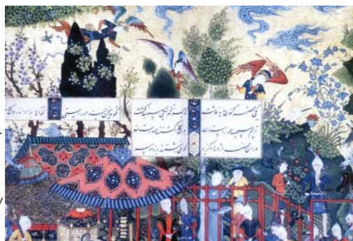
تصویر شماره ۴- قسمتی از یک تصویر از شاهنامه شاه طهماسبی، سده ۱۰ هجری برگرفته از کتاب شاهکارهای نگارگری ایرانی، موزه هنرهای معاصر تهران.

کاربرد رنگ طلایی در آسمان و حضور فرشتگان در این فضا بسیار نزدیک به توصیف عالم سراسر نور ملکوت است. ضمن اینکه «انوار ملکوتی موردنظر سهروردی انواری برگرفته از فرشتگانند. این انوار ملکوتی دارای اشراقی بی‌واسطه و مستقیم برگرفته از اشراق انوار و از بنیاد فرشته‌سانند» (کرین، ۱۳۸۴: ۳۲).