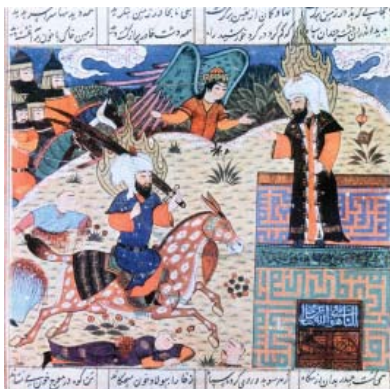
تصویر شماره ۳- تصویر از خاوران نامه ابن حسام، جبرئیل قدرت حضرت علی را به حضرت محمد (ص) نشان داد. شیراز، حدود ۱۴۸۰، موزه هنرهای تزئینی تهران.

۹- کتاب خاوران نامه ابن حسام، یک کتاب حماسی و مربوط به زندگی حضرت علی (ع) است و در ۱۴۲۶ تألیف و به تقلید از شاهنامه تهیه گردیده است. نک: بازل گری، نقاشی ایرانی، ترجمه عربعلی شروه، ص ۹۳.