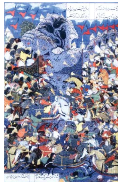
تصویر شماره ۱- تصویری از شاهنامه شاه طهماسبی، سده ۱۰ هجری، برگرفته از کتاب شاهکارهای نگارگری ایرانی، موزه‌های هنرهای معاصر.

در این تصاویر نمادین، تجلی نور معنوی به صورت تجسم آسمان‌های طلایی که عالم سراسر نور خوارنه و حضور نور ایزدی را در جهان هستی نمایندگی می‌کند، هاله‌های نور طلایی رنگ دور سر قدیسین پیامبران و شهریان کیانی، که نشان از برخورداری انسان‌های کامل از خوره شهریاری یا "قره ایزدی" خاص آن‌ها می‌دهد، تجسم گرفت و گیر نیروهای خیر و شر، نور و ظلمت در قالب داستان‌های حماسی مانند نبرد بهرام گور و اژدها، دادخواهی کاوه آهنگر از ضحاک و یا بیان سمبلیک آن در قالب فرم‌های حیوانی مانند گرفت و گیر شیر و گاو و یا تصویر موجودات فرامادی، مانند فرشتگان ۸ و دیوها مشهود است، که نشان از خلاقیت و توانایی هنرمند ایرانی در تجسم محسوس دنیای خیالی اوست.