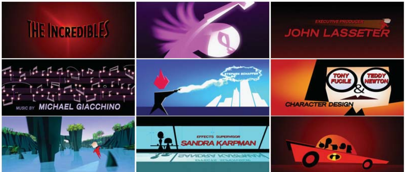
تصویر ۲، خارق‌العاده‌ها (گرافیک در تیتراژ، ۱۳۸۸).

پایان‌بندی فیلم "خارق‌العاده‌ها" ۲۶ از این دسته است؛ زمانی که عناصر گرافیکی حرف اول را می‌زنند! با این که اثر تصویرمتحرک است، اما عنوان‌بندی آن از سادگی گرافیکی عناصر بهره می‌برد و شخصیت‌ها را با موجزترین نشانه‌های بصری در حال نمایش قدرت، حرکات سریع و عبور از میان انفجارها و مانع‌ها به تصویر می‌کشد (تصویر ۲).