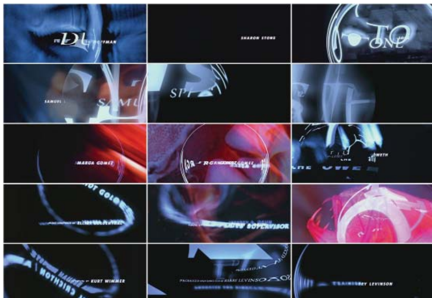
تصویر ۳، کره (نوشته در تیتراژ، ۱۳۸۸).

هل دادن او از تراس مهمانی و همچنین هویت "دله دزد" بودن شخصیت اصلی در پلان اول با پریدن او از روی فنس‌ها نشان داده می‌شود. تصاویر ساده شده از اثر شلیک گلوله، تصاویر زنان، خون‌های ریخته‌شده و همچنین بازیگران اسلحه به دست هم در این عنوان وجود دارند و رنگ غالب عنوان هم آکر و سیاه است. اثر دیگری که در این بحث می‌گنجد، عنوان ابتدایی فیلم "دفن شده" ۲۹ است. این کار در میان آثار جدید شاید شبیه‌ترین عنوان‌بندی‌ها به سبک استاد این رشته یعنی "ساول باس" باشد. در توضیح خبرنگار پیش از آغاز مصاحبه با "خورخه کالوا" ۳۰ طراح این عنوان‌بندی،