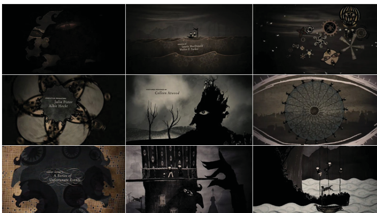
تصویر ۱، مجموعه‌ای از حوادث ناگوار (گرافیک در تیتراژ، ۱۳۸۸).

ممکن موجود برای ساختن عنوان‌بندی از این قرار است: