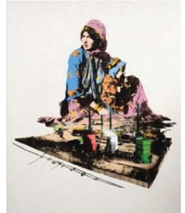
تصویر شماره ۶، عنوان اثر: نفت و رنج (مجموعه برف شادی) نقاش: امین روشن سال خلق اثر: ۱۳۹۲ تکنیک: اکریلیک و نقاشی با نفت خام بروی پارچه، سیلک اسکرین.

درست است که زنان در این قوم به دلیل حجم بسیار از کارهای روزانه، حتی تنهایی‌شان را