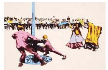
تصویر شماره ۷ عنوان اثر: کفش‌های قرمز (مجموعه برف شادی) نقاش: امین روشن سال خلق اثر: ۱۳۹۲ تکنیک: اکریلیک و نفت با استفاده از سیلک اسکرین بر روی بوم. همان منبع.