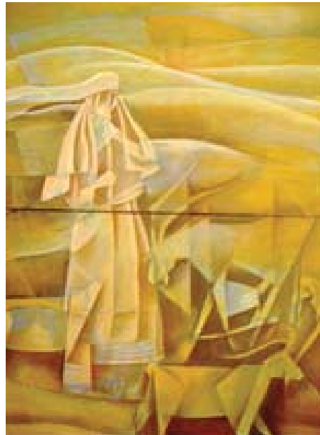
تصویر شماره ۱۰، عنوان اثر: زن بختیاری، نقاش: بختیار سامه، سال خلق اثر: ۱۳۸۹، تکنیک: اکریلیک.