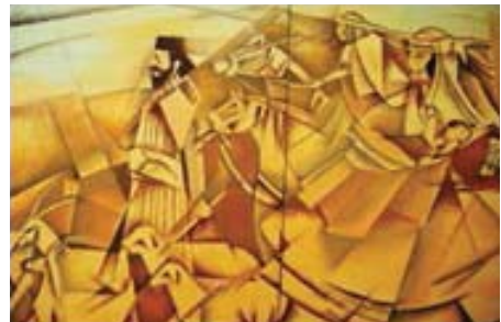
تصویر شماره ۱۱، عنوان اثر: کوچ، نقاش: بختیار سامه، سال خلق اثر: ۱۳۹۱، تکنیک: اکریلیک.