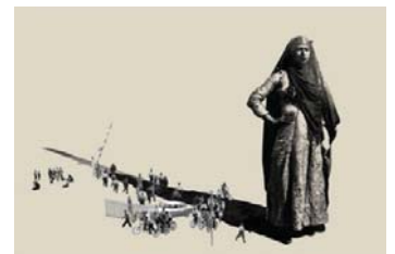
تصویر شماره ۸ عنوان اثر: زن بختیاری (مجموعه برف شادی) نقاش: امین روشن سال خلق اثر: ۱۳۹۲ تکنیک: اکریلیک و نفت با استفاده از سیلک اسکرین بر روی بوم. همان منبع.