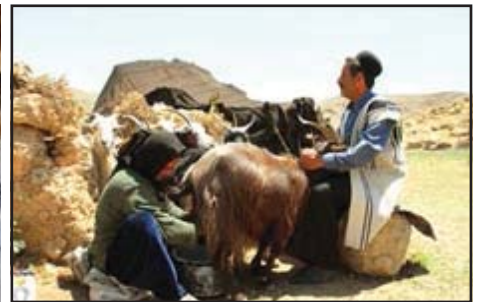
تصویر شماره ۱- تصاویری از زنان بختیاری و فعالیت مستمر روزانه آنها در عشایر بختیاری خوزستان - ایذه