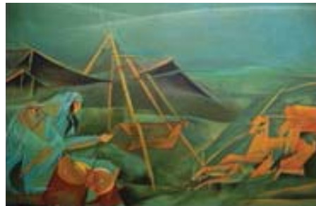
تصویر شماره ۱۲، عنوان اثر: مشکدو، نقاش: بختیار سامه، سال خلق اثر: ۱۳۹۱، تکنیک: اکریلیک. زنان برای تبدیل ماست به دوغ آن را در «مشکدو» می‌کنند و مدتی تکان می‌دهند.