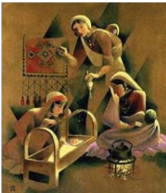
تصویر شماره ۲-۳-۴-۵،