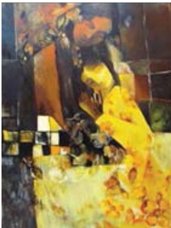
تصاویر شماره ۱۳-۱۴-۱۵ عنوان اثر: بانوی بختیاری، نقاش: ثریا ابدالی راد، سال خلق اثر: ۱۳۹۵، تکنیک: رنگ و روغن.