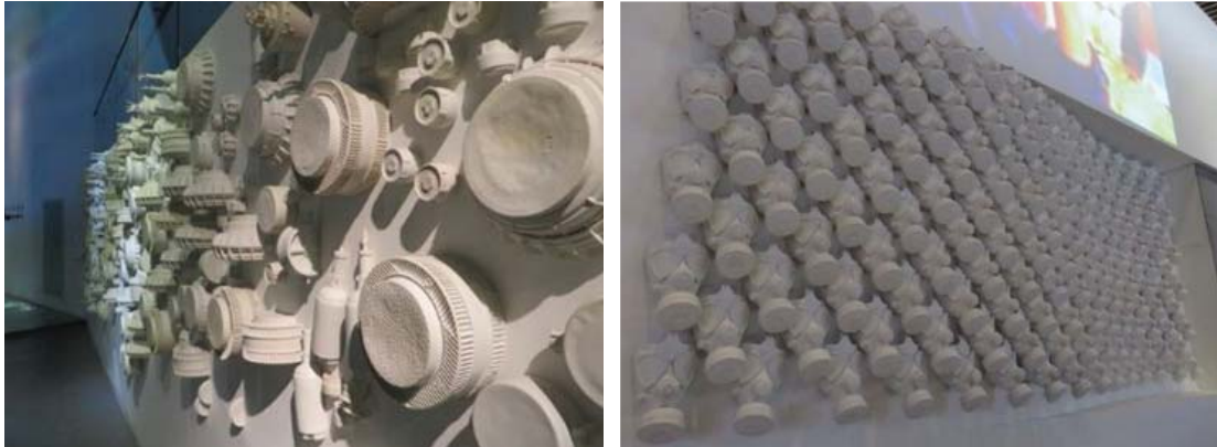
تصویر ۹- نمایی از ماسک‌ها و مین‌ها، باغ‌موزه دفاع مقدس، ماخذ: نگارندگان