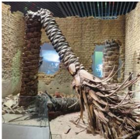
تصویر ۱۱- سلاح و گل‌های میخک، باغ‌موزه دفاع مقدس

بیشترین تلاش هنر مقاومت در جهت نمایش هویت، اعتبار ملی، فرهنگی و مذهبی ملت استوار است و یکی از راه‌های اعلام هویت و روحیه جمعی در هنر، نمایش آن به شکل سمبولیک و نمادین است. با معرفی آن چه هنر مفهومی نامیده می‌شود و اشاره به انواع نشانه از دید پیرس ۲۱ دارد، می‌توان به این نکته پرداخت که آثار هنری که در غالب هنر مفهومی قرار می‌گیرند چه نوع نشانه‌ای محسوب می‌شوند و معنی نشانه‌ها در آن‌ها تا چه اندازه خودانگیخته و طبیعی و تا چه اندازه قراردادی است. «این دریافت که پس‌زمینه تصویر ممکن است آن را از نشانه شمایی به نشانه نمادین تبدیل کند، منجر به ورود فزاینده عکس به قلمرو هنر مفهومی شد» (سمیع آذر، ۱۳۹۲: ۶۶). «در این راستا هر شکل فیگوراتیو، الزاماً شمایی نیست؛ بسیاری از تصاویر قابل تشخیص، مثل تصویر انسان و یا اشیاء معین، ممکن است از حیث نشانه‌شناسی نماد محسوب شود. به سخن دیگر شمایی بودن یک تصویر، صرفاً متکی بر شکل عینی و بازنمایی شده آن نیست، بلکه ناشی از قابل‌شناسایی بودن موضوع آن تصویر است» (همان: ۶۶). افزاینده در مبحث نشانه‌شناسی هنر مفهومی معتقد است: «توصیف هنر مفهومی به مثابه گرایش در هنر