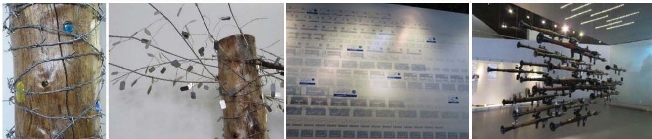
تصویر ۲- باغ‌موزه دفاع مقدس، (ماخذ: نگارندگان)

می‌توان از آن سرسری گذشت» (وود، ۱۳۸۳: ۴۸). «در این هنر ایده، یک مفهوم بسیار مهم‌تر از شکل بیرونی اثر است. وقتی هنرمند از روش‌های مفهومی در هنر بهره می‌برد بدین معناست که تمامی محاسبات، نقشه‌ها و تصمیمات از قبل حاصل شده و اجرا، صرفاً یک کنش نهایی و سطحی است. در این جا ایده تبدیل به ماشینی می‌شود که تولید کننده هنر است. این گونه از هنر، نه نظری و نه تصویرگر نظریه‌هاست. بلکه هنری است غیراستدلالی که توسط درک مستقیم و بلاواسطه شناخته می‌شود» (امیر حاجی، ۱۳۹۲: ۳۳-۳۴) علی‌رغم تفاوت‌های تکنیکی و استفاده گوناگون از رسانه‌ها و مصالح گوناگون در ایجاد هنر مفهومی «تمام مقالات، پژوهش‌ها و نمایشگاه‌های هنر مفهومی، بیانگر این حقیقت است و در نهایت این کوچکترین نقطه اشتراک را به هم دارند که در هنر مفهومی بر بخش «تفکر» هنر و درک آن تاکید روشنی شده است» (مارزونا، ۱۳۹۰: ۱۱) (تصویر ۲)