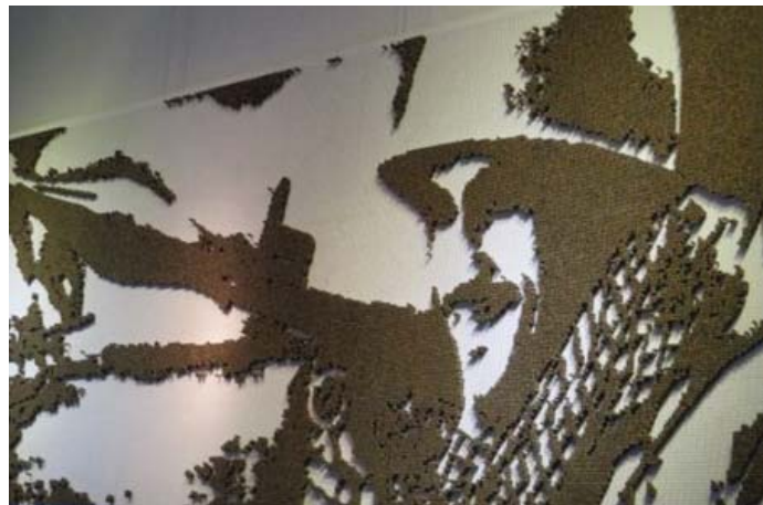
تصویر ۱۰- تابلویی از پوکه اسلحه، باغ‌موزه دفاع مقدس، ماخذ: نگارندگان