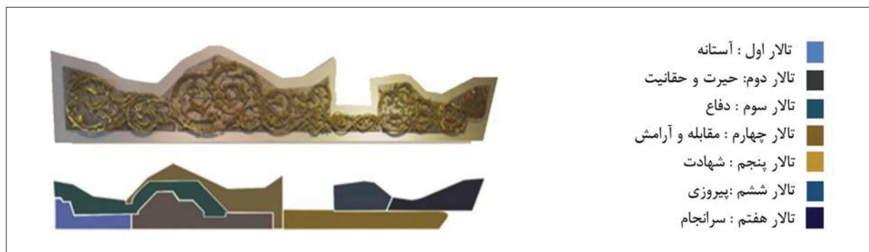
تصویر ۱ - تقسیم بندی تالارهای باغ موزه دفاع مقدس، ماخذ: نگارندگان

کمک نشانه‌های زبانی و مفهوم‌سازی‌های فلسفی، منطقی و علمی نتوانیم واقعیتی، رویدادی و یا تجربه ای انسانی را تبیین و آن را به مخاطبان مورد نظر نشان دهیم بی‌درنگ متوجه ظرفیت‌های هنر می‌شویم» (باوندیان، ۱۳۸۸: ۲۷).