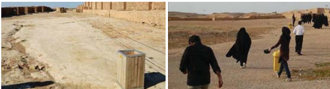
تصویر ۱: سطل‌های زباله پلاستیکی و چوبی، (منبع مرکز مطالعات چغازنبیل)

سطل‌های زباله این منطقه به دو دسته سطل‌های پلاستیکی و سطل‌های چوبی تقسیم می‌شود که سطل‌های پلاستیکی با رنگ زرد نه تنها با محیط و سطل‌های دیگر هماهنگی ندارد، بلکه باعث ایجاد اغتشاش بصری و نازیبایی محیط شده‌است. علاوه بر این پلاستیک تشکیل‌دهنده این سطل‌ها نیز متناسب با منطقه و مصالح بومی نبوده و در اثر تابش آفتاب دچار فرسایش نیز می‌شود (تصویر ۱).