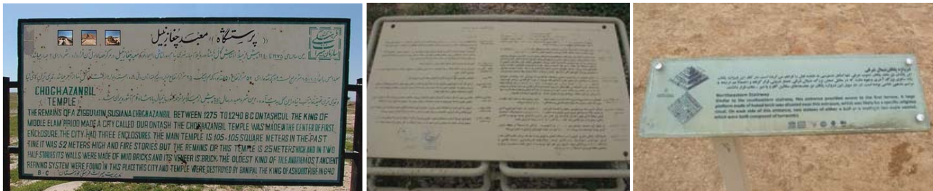
تصویر ۳: تابلوهای اطلاع رسانی منطقه جغازنبیل، (منبع نگارنده)

تابلوهای راهنمای این منطقه به چند دسته تقسیم می‌گردند که عمده آن‌ها تابلوهای اطلاع رسانی هدایت‌گر هستند. جنس این تابلوها عموماً از فلز است که با رنگ کرم زمینه در مقابل قسمت‌های مختلف بنا، نقش اطلاع‌رسانی خود را انجام می‌دهند. در قسمت رویی بعضی از آن‌ها شیشه‌های محافظ قرار داده شده و بعضی دیگر فاقد این شیشه‌ها هستند که این موضوع باعث تسریع روند فرسایش رنگ این تابلوها در اثر بارش باران و تماس با محیط اطراف است. بیشتر شیشه‌های محافظ تابلوها با گذشت زمان و در تماس با عوامل طبیعی دچار فرسایش و خرابی شده‌اند. نوشته‌ها و رنگ روی تابلوها اغلب مخدوش شده و در بعضی از قسمت‌های آن خصوصاً در تابلوهای بدون شیشه به دلیل کمرنگ شدن و یا پاک‌شدن نوشته‌ها خوانایی کم شده است. علاوه بر آن به دلیل جنس فلزی تابلوها و پایه‌ی آنها در تماس با رطوبت دچار اکسایش گردیده است (تصویر ۳).