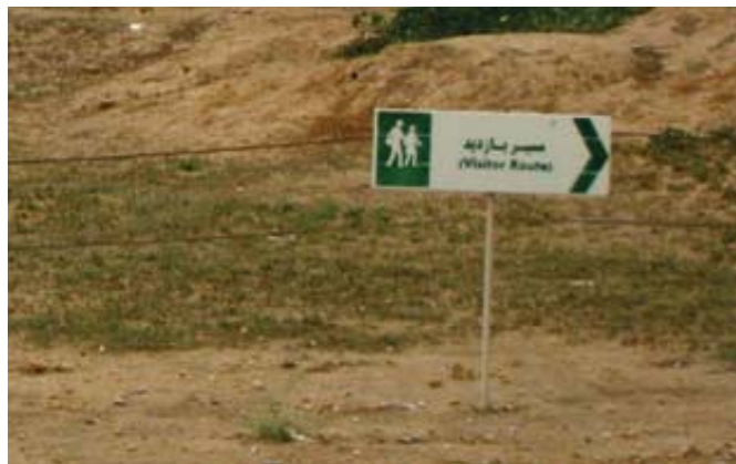
تصویر ۴: تابلوی هدایت گر، (منبع نگارنده)

گردند، می‌توانند به بهترین وجه ممکن در هماهنگی با محیط و نمایش هویت و حس مکان عمل کرده و باعث ایجاد نمای مطلوب بصری گردند. این موضوع باعث ایجاد فضایی مناسب برای گردشگران شده و تصویری ماندگار در ذهن آن‌ها از محیط به وجود می‌آورد. علاوه بر این