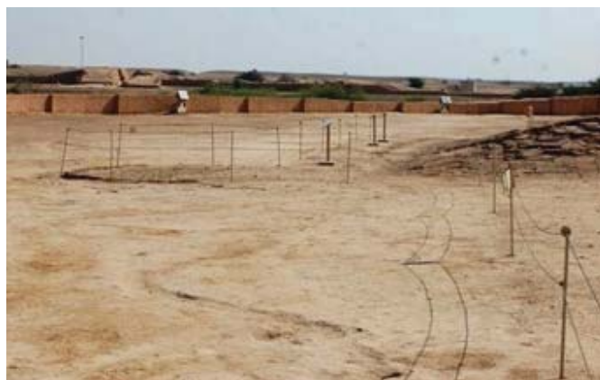
تصویر ۵: حصارکشی اطراف محدوده تاریخی چغازنبیل