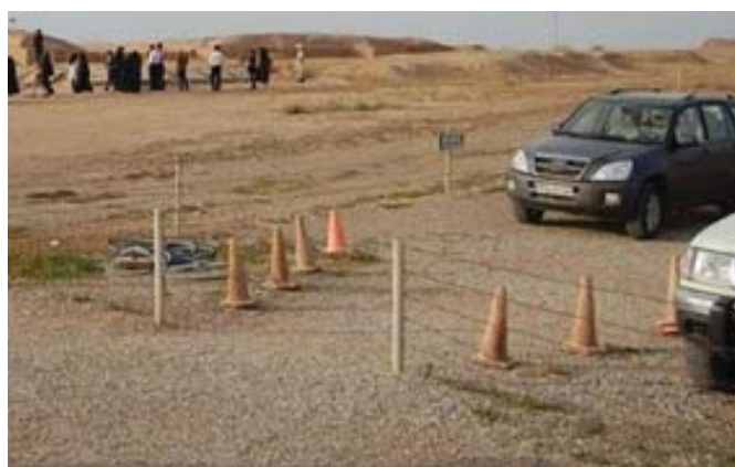
تصویر ۶: تیرک‌های ورودی منطقه تاریخی چغازنبیل، (منبع مرکز مطالعات چغازنبیل)