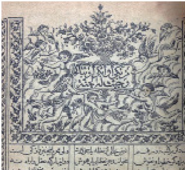
تصویر ۲. سرلوح کتاب طوفان البکاء. جوهری (۱۳۵۵ه.ق). موزه ملی ملک

سرلوح: کتاب دارای دوسرلوح با نقش فرشتگان و گلدان گل درمیانه آن است. در مورد نقوش به کار رفته در سرلوح باید اشاره شود که با گذشت زمان از بدو ورود چاپ به ایران، به تدریج نقوش مصورکننده کتب چاپی اروپایی به کتاب‌های چاپی فارسی نیز راه یافت و جای نقوش سنتی رایج ایرانی را گرفت. نقش فرشتگان و گلدان‌های بزرگ و دسته‌های گل، به تمامی از اروپا نشأت گرفته‌اند. و به کار بردن آن‌ها در سرلوح صرفاً جنبه تزئینی داشته و با موضوعات کتاب‌ها مرتبط نیستند. (تصویر ۲)