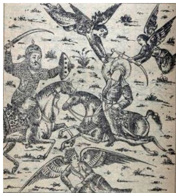
تصویر ۳: مجلس دوم، غزوه خیبر. کتاب طوفان البکاء جوهری (۱۳۵۵ ه.ق). موزه ملی ملک

جنگ خیبر موضوع مجلس دوم کتاب است که دربارهٔ پیکار امیرالمؤمنین (ع) با مرحب خیبری است که از دیدگاه شیعه یکی از نقاط عطف تاریخ اسلام است، چرا که به گواهی تاریخ، در این جنگ جز حضرت علی (ع) کسی را یارای مقابله با مرحب نبود و غلبه ایشان بر او چنان برای حفظ اسلام نوپا حیاتی بود که پس از ظفریافتن ایشان و فتح قلعه خیبر، بساط فتنه انگیزی‌های یهودیان علیه اسلام و مسلمین صدراسلام برچیده شد و پیامبر (ص) فرمودند که با پیروزی در این جنگ، اسلام از خطر یک فتنه بزرگ نجات یافت. به جهت اهمیت این واقعه برای مسلمین و به‌ویژه شیعیان که خود را از رهروان حضرت علی (ع) می‌دانند و به این ارادت خویش مباحثات می‌کنند، این پیروزی بارها و به اشکال گوناگون توسط نقاشان مسلمان در دوره‌های گوناگون تاریخی، چه در کتب خطی و چه در کتب چاپی به تصویر کشیده شده است. نقاشان مذکور برای نشان دادن اهمیت واقعه، معمولاً حساس‌ترین لحظه این جنگ را به تصویر کشیده‌اند که در آن فرشتگان مقرب دست امیرالمؤمنین (ع) را برای زدن ضربه نهایی به حریف، هدایت می‌کنند؛ در این مجلس نیز تصویرگر چنین کرده‌است.