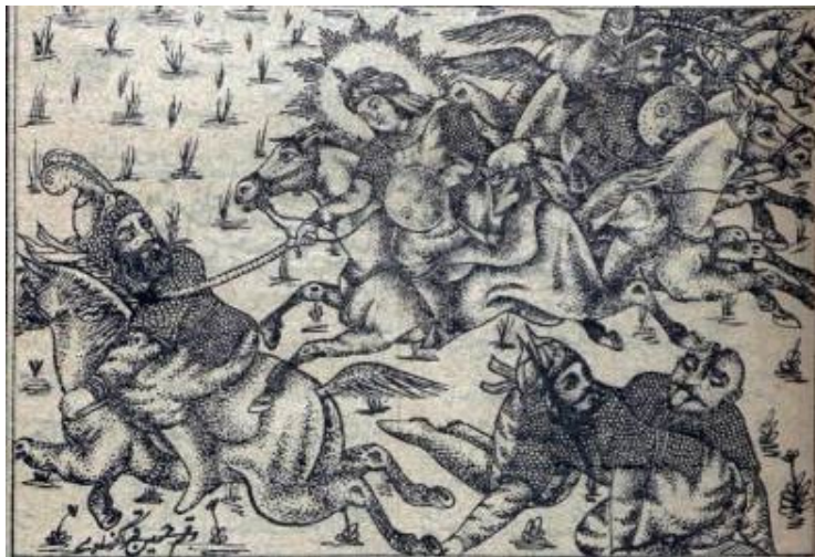
تصویر ۴. مجلس پنجم. شهادت حضرت قاسم (ع). کتاب طوفان البکاء، جوهری (۱۳۵۵ ه.ق). موزه ملی ملک

در تصویرگری این مجلس هم از این امر پیروی شده و ما نه با صحنه شهادت حضرت قاسم، بلکه با لحظه اوج نبرد شجاعانه او با ازرق شامی ۵ روبرو هستیم. پیکر سوار بر اسب او تقریباً در میانه و سمت بالای کادر قرار گرفته و اولین پیکره ایست که در نگاه اول به چشم می‌آید. هر چند به علت هم‌مرز بودن پیکره با گروه سواران پشت سرش، به تمایز او به عنوان شخصیت اصلی با سایرین، اندکی لطمه وارد شده است. با وجود هاله نورانی برگرد سرش به عنوان یک شخصیت والامقام، اما چهره‌اش توسط نقاش عمداً به نمایش درآمده است تا برای مخاطب شیعه یادآور چهره‌ای باشد که به پاره‌ای از ماه تشبیه شده است نقاش برای آنکه جوانی او را نشان دهد چهره‌ای فاقد محاسن به او بخشیده است که نتیجه آن تضادی است که صورت جوانش با نیروهای متخاصم گرداگردش دارد. در حالی که پسران ازرق شامی که پیش از خودش توسط حضرت قاسم سرنگون شده‌اند، نیمه سمت راست پس‌زمینه را پر کرده‌اند، ایشان بی‌باکانه بسوی