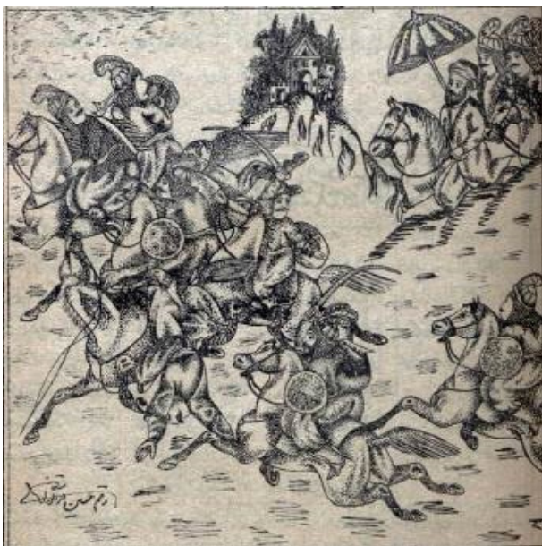
تصویر ۵. مجلس ششم. شهادت حضرت عباس (ع). کتاب طوفان البکاء جوهری (۱۳۵۵ ه.ق). موزه ملی ملک

عاشورایی تبدیل به نمادی از جانبازی و شهامت نموده و به سقای کربلا شهره کرده است. این حادثه به دلیل تأثیرگذاری فوق العاده آن، منشاء آفرینش تصاویر بسیاری چه در کتب مصور چاپی و چه در تابلوهای نقاشی قهوه‌خانه‌ای شده است. نقاش در اینجا نیز به پیروی از تصاویر قبلی، علی‌رغم نام مجلس که شهادت حضرت عباس است، نه لحظه شهادت را و نه پیکر بی‌دست را تصویر کرده، بلکه لحظه اوج رشادت را مصور نموده است. اما برخلاف تصاویر قبلی، پیکر سوار بر اسب حضرت عباس، نه با هاله دور سر و نه با پوشیدگی چهره، بلکه تنها با مشک آبی که بردوش دارد از سایرین قابل تشخیص است. مشکى که به کودکان تشنه لب نخواهد رسید و او سواری است با مشک آبی در یک دست که با دست دیگرش به سمت دشمن حمله ور شده است؛ دستی که قرار است لحظاتی بعد از تنش جدا شود. ترکیب‌بندی اما به جهت عدم جایگیری مناسب پیکرها چندان موفق از کار درنیامده است. پیکر حضرت عباس در نیمه پایین کادر واقع شده، اما به دلیل هم‌مرز شدن سر و دست