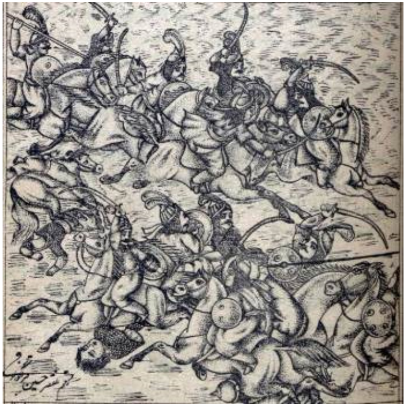
تصویر ۶. مجلس هفتم. شهادت حضرت علی اکبر (ع). کتاب طوفان البکاء. جوهری (۱۳۵۵ ه.ق). موزه ملی ملک

عمداً به تصویر درآمده و با هاله ای نورانی گرد سرش از دیگران متمایز شده است، تا برای شیعه یادآور این جمله از مولایشان حسین (ع) باشد که فرزند برومندش را أَشْبَهُ النَّاسِ خَلْقًا وَ خُلُقًا وَ مَنَظِقًا بِرَسُولِكَ (ص) می نامید. (سیدبن طاووس، ۱۳۹۲: ۱۵۲) این بار نیز نقاش لحظات اوج حماسه آفرینی او را به تصویر کشیده است. هر چند که پیکر نسبتاً کوچکش در میان انبوه اسب سواران، در نگاه اول به دشواری قابل تشخیص است. از لحاظ زاویه دید اسبها به تمامی از نیم رخ ترسیم شده اند. سواران اما با زاویه دید متنوع تری ترسیم شده اند. به طور کلی آنچه در این مجلس بیش از هر چیز جلب نظر می کند، نمایش همزمان دو حمله و جایگزینی اریب گونه ردیف سواران در کنار حرکات تهاجمی شان در حمله و دفاع است که در مجموع ترکیب بندی پرکنشی را ایجاد کرده است. (تصویر ۶)