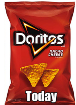
تصویر ۹. بسته کنونی محصول چیپس برند دوریتوز منبع تصویر: https://www.zoomit.ir