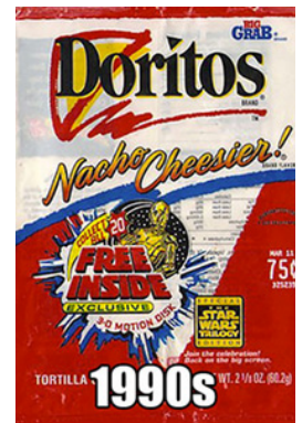
تصویر ۸. بسته سال ۱۹۹۰ محصول چیپس برند دوریتوز