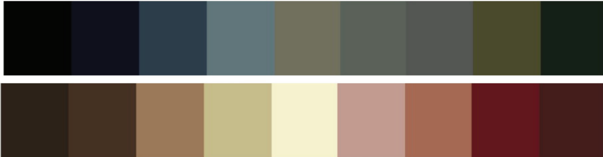
تصویر ۵: پالت رنگی قالی یزد (نگارنده).

گردو)-ساق چناری (نیل+پوست گردو+جاشیر)-فولادی یا دودی (نیل+پوست گردو)-بیدمشکی یا ماشی که به آن ارتشی و یا مله‌ای هم گفته می‌شود (پوست گردو+جاشیر+روناس برای قرمزی آن)-سبز پررنگ (جاشیر+نیل به نسبت سبز مورد نیاز)-قهوه‌ای (پوست گردو+پوست انار+روناس)-دارچینی (روناس+پوست گردو)-خاکی یا شتری (پوست گردو+روناس)-نخودی (جاشیر+پوست انار+اسپرک+برگ مو)-کرم (گاه گندم) یا (روناس+جاشیر)-پوست پیازی (پوست گردو+روناس)-مسی (روناس+اسپرک)-لاکی (روناس+جاشیر برای زردی آن)-روناسی (روناس)-سفید البته این رنگ‌ها در مناطق مختلف با اسامی دیگری نام‌گذاری می‌شوند، مثلاً رنگ بیدمشکی که در قالی‌های یزد کاربرد دارد در کاشان با نام مله‌ای و در بعضی مناطق با نام ماشی نام‌گذاری شده‌اند. از کم‌رنگ یا پررنگ کردن هر یک از آن‌ها به وسیله‌ی دندان‌ها و مواد کمکی، رنگ‌هایی حاصل می‌شود که در بافت قالی‌های این منطقه مورد استفاده قرار می‌گیرد.