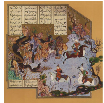
تصویر ۱. فریدون پسران خود را می‌آزماید، اثر آقامیرک، شاهنامه، قرن دهم

از دیگر صفات آثار حماسی بقا و جاودانگی است. ماهیت ازلی آثار حماسی موجب می‌شود که از زمان و مکان فانی فراتر روند و در صورتی از بقا به همه زمان‌ها و همه