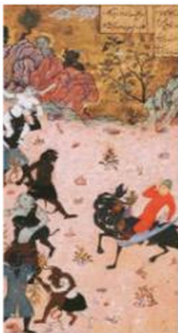
تصویر ۲. اسب نخوت ماهان به اژدهای هفت سر تبدیل می شود. اثر بهزاد، خمسه نظامی، هرات، کتابخانه بریتانیا، لندن، ۱۴۹۳