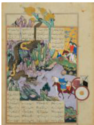
تصویر ۱۰. نبرد اسفندیار و اژدها، مکتب اصفهان

اژدهای آسیایی دارد. اما از آن جا که آتش از دهانش خارج می شود به اژدهای اسطوره‌ای اروپایی شباهت داشته و میل به آدم خوری دارد. به عبارت دیگر اژدهای ایرانی ظاهر اژدهای آسیایی و ویژگی اژدهای غربی را دارد و با وجود این در مواردی با هر دو گونه متفاوت است. اژدهاهای ارائه شده در هنر چینی و ژاپنی بسیار متنوعند و به خصوص از لحاظ تعداد انگشتان و شیوه ترسیم شان متفاوت می باشند. بطور کلی می توان خصوصیات کلی اژدهای ایرانی و وجوه تمایز آن را با اژدهای چینی و ژاپنی در چند مورد خلاصه نمود.