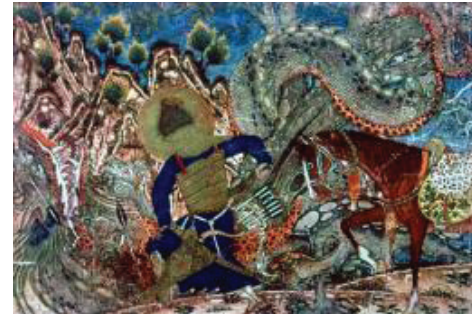
تصویر ۵. بهرام گور شمشیر خود را در سینه اژدها فرو می‌برد، شاهنامه بزرگ، مکتب تبریز، مجموعه رینی راجرز، دوره ایلخانی ۷۴۰ ه.ق

۲۸. نبرد گشتاسب با اژدها در شاهنامه‌ای متعلق به ۱۰۰۷-۹۸۷ هجری نیز وجود دارد.