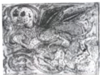
تصویر ۳. اژدها با سر انسانی در حال جنگ با ماران. عجائب المخلوقات قزوینی، سده شانزدهم/دهم