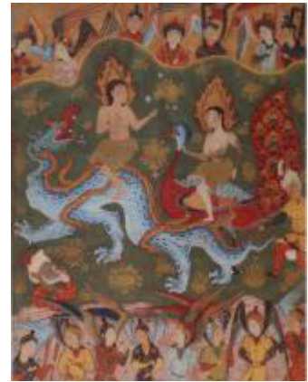
تصویر ۱۱. تبعید آدم و حوا از بهشت، فال نامه، اثر جعفر صادق، گالری ساکلا واشنگتن، تبریز یا قزوین، ۹۵۰ ه.ق

حضرت موسی به اژدها در محضر فرعون دلالت دارند. در روایات چنین آمده که شیطان با کمک مار و طاووس به بهشت راه یافت و آدم و حوا را به خوردن میوه ممنوعه تشویق کرد. در نگاره‌ی مذکور مار به صورت اژدهایی نمایان شده است. در منطق الطیر عطار نیز از نقش طاووس در این واقعه سخن به میان آمده است. در نگاره مربوط به حضرت موسی چنان که در قرآن و انجیل آورده شده، عصای ایشان در مقابل فرعون به اذن خداوند به اژدهایی بدل می‌شود که سحر جادوگران را باطل و مارها و افعی‌های آنان را می‌بلعد. به هر حال نقش پردازی درخشان، رنگ‌های پر انرژی و طرح‌های خلاقانه و بی‌پروای این دو نگاره چشم‌گیر و جالب توجه‌اند. همچنین نگاره‌های مربوط به مواجهه پیامبر (ص) با اژدها ۴۲ و مبارزه حضرت علی (ع) با اژدها ۴۳ نیز در این دسته قرار می‌گیرند. در آخر می‌باید از نمونه‌ای منحصر به فرد (تصویر ۱۳) نام ببریم که درگیری جمعی از فرشتگان و تعدادی اژدها را به تصویر کشیده است. این نگاره را شاید بتوان نمایشی مستقیم و بلاواسطه از نبرد میان نیروهای اهورایی و اهریمنی برشمرد.