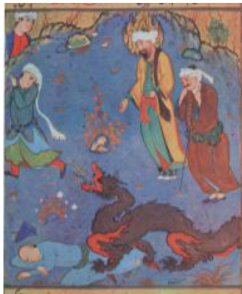
تصویر ۱۲. حمله اژدهای موسی به خدمتکاران فرعون، اثر آقا رضا، قصص الانبیاء نیشابوری، کتابخانه ملی پاریس، ۱۰۰۰-۹۹۰ ه.ق.