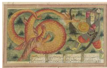
تصویر ۸. نبرد اسفندیار و اژدها، شاهنامه، قرن دوازدهم

اول آنکه اژدهای ایرانی اغلب در پای عقب زائده دارد، در حالی که دیگر اژدهاها فاقد این عضوند. دوم اینکه اژدهای ایرانی یک شاخ در وسط پیشانی دارد که معمولاً دو بخش شده، اما این اندام در صورت وجود در اژدهای چینی و ژاپنی جفتی است، یک شاخ در هر طرف سر. سومین مورد مربوط به دم اژدهای ایرانی است که ویژگی خاصی ندارد، در حالی که اژدهای چینی دم می مویی (مانند دم گاو) دارد و گفته می شود وجه تمایز جنس نر آن از جنس ماده است. چهارمین وجه تمایز این است که اژدهای ایرانی اغلب در حال دمیدن آتش مشاهده می شود، ولی نوع چینی به ندرت آتش یا بخار می دمد. این دم آتشین تقریباً در تمامی نگاره‌ها دیده می شود و از دهان و نه سوراخ‌های بینی خارج می شود و مانند اژدهای اروپایی زبان با آتش احاطه شده است. ۳۸ به نظر می رسد اژدهای ایرانی