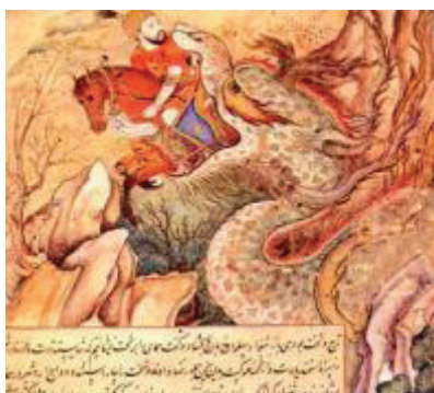
تصویر ۴. اژدها اردشیر و اسبش رامی بلعد، داراب نامه، قرن دهم

مکان‌ها متعلق گردند. این مهم از نقاط مشترک عرفان و حماسه است چراکه عارف میدانند که کل یوم عاشورا و کل ارض کربلاء، نگارگری نیز بازتاب چنین ساحتی است. ۲۴ کلیه مفردات یک نگاره اعم از اشکال انسانی، حیوانی، نباتی و جمادی کوششی در به تصویر درآوردن امور ثابت و بی تغییر ازلی است. بافت و شکل صخره‌ها، صورت‌های انسانی که از درون صخره‌ها سر برآورده‌اند، ابرهایی که به ساده‌ترین شکل تصویر شده‌اند و درحقیقت دوایری متعدد و درهم گره خورده‌اند، همه و همه حرکت، رهایی از فنا و میل به جاودانگی را تداعی می‌کند. (عصمتی، ۱۳۸۸) در نگاره‌های مورد بحث این مقاله نگارگر لحظاتی را برای به تصویر کشیدن انتخاب کرده است که جنگجو در مقابل اژدها قرار گرفته، در این لحظه نه غالب شده است و نه مغلوب و این امر تداعی گر روح تداوم مبارزه حق و باطل است. این ویژگی در زبان رنگ‌ها نیز مشاهده می‌شود و علاوه بر آن شفافیت و ماندگاری خود رنگ‌ها پس از گذشت چند صد سال بر آن صحنه می‌گذارد.