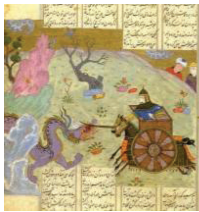
تصویر ۹. نزاع اسفندیار و اژدها، مکتب هرات