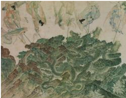
تصویر ۱۳. حمله فرشتگان به لانه اژدهایان، اثر استاد محمد، آلبومی منسوب به غرب ایران (یا آسیای میانه)، موزه توپقاپی، قرن ۹-۸ ه.ق

پیچ و تاب‌های بدن اژدها و حرکات پای اسب‌ها مشهود است. در تصاویری که همراه متن آمده‌اند این رویکرد و حس حرکت از طریق چیدمان فاصله دارستون‌ها (تصاویر ۸ و ۱۰) و همچنین بالا و پایین بودن بلاک‌ها (تصاویر ۹ و ۱) تأکید و تقویت شده است. اگرچه بیشتر نگاره‌های حاوی اژدها مضمونی حماسی دارند، اما نگاره‌های انگشت شماری نیز وجود دارند که از داستان‌های مذهبی سرچشمه می‌گیرند، بطور مثال تصاویر ۱۱ و ۱۲ به ترتیب بر داستان هبوط حضرت آدم و حوا از بهشت و داستان تبدیل عصای