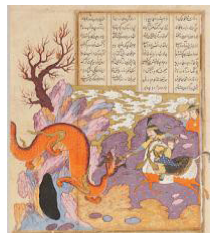
تصویر ۷. نبرد گشتاسب و اژدها، شاهنامه صفویه، قرن نهم