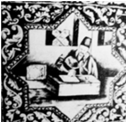
تصویر ۶. کاشی با نقوش تزئینی اسلیمی روکوکویی، از کاخ گلستان، مأخذ: (برند، ۱۳۸۳: ۱۸۷)

نمایشگاهی اعلام شد که در پاریس برگزار می‌شد. این سفر رسمی نبود و چنین اعلام کردند که چون در سفر پیشین شاه به سبب دیدارهای رسمی با روسای دول فرصت بازدید از صنایع فرنگ را نداشت، این بار برای جبران آن به سفر می‌رود (عدل، ۱۳۷۵: ۲۲۱-۲۲۰).