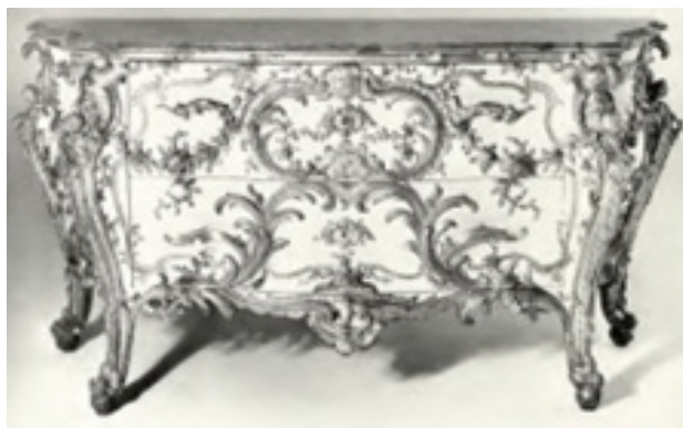
تصویر ۴. تزئینات با نقوش اسلیمی دکوراسیون دوره رو کوکو