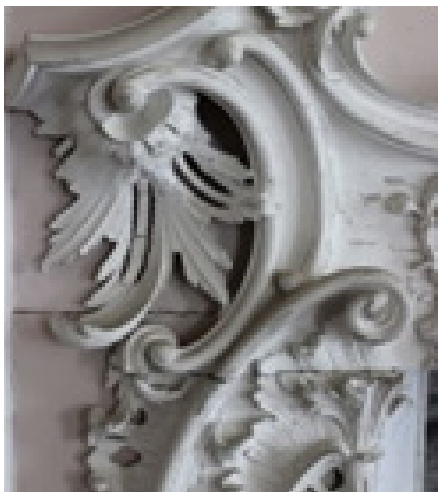
تصویر ۲. طرح اسلیمی روکوکویی گچ‌بری داخلی، ۱۷۶۰، خانه کلایدون، ماخذ: (www.pinter- est.com)

به معنای هنر پرزرق و برق و تجملی بود. روکوکو به مثابه یک سبک، واکنشی بود در برابر شیوه هنری خشک و رسمی که در آن زمان وجود داشت؛ از این رو مثلاً در نقاشی، موضوع‌های دنیوی و سبکسرانه، رنگ‌های لطیف و خط‌های منحنی ظریف به کار برده می‌شد. این نوع نقاشی سرشار از جلوه‌های شاد و فریبنده با سلیقه اشرافیت آن روزگار بود (پاکباز، ۱۳۷۹: ۲۵۶). سبکی است که کمتر توسط حکومت‌های سلطنتی و کلیسا، و بیشتر توسط افراد ثروتمند، که خود را به عنوان حامیان هنر جدید تبدیل کردند مورد استفاده قرار گرفت (Charles, 2014:305) اسلیمی در نیمه‌ی اول قرن شانزدهم وارد هنر کشورهای ایتالیا، فرانسه و آلمان شد؛ این تأثیرپذیری از راه هنر اسپانیا ممکن گردید. هنر اسپانیایی، بیشتر اسلامی است و آنچه که به نقاط دیگر برده می‌شد طبیعتاً با روحیه هنری و فرهنگ بصری این مردمان نیز آمیخته بود. از سوی دیگر، این نقوش توسط سفرها و مهاجرت‌های بسیاری که صنعتگران ایرانی و سوری به ونیز می‌کردند، به قلب اروپا راه یافت و این‌ها همگی در آفرینش گونه‌ای از اسلیمی اروپایی که مورسک نام داشت و صرفاً هنری تزئینی بود، دخالت مستقیم یافت و باعث آفرینش نمونه‌های جدید از مایه‌های اسلیمی گردید که در نوعی زیباشناسی اروپایی نیز صیقل یافته بود (جونز، ۱۳۸۶: ۳۲-۳۱).