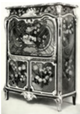
تصویر ۵. تزئینات دکوراسیون دوره رو کوکو، ماخذ: (همان: ۱۸۳)