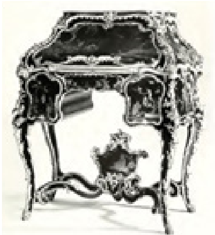
تصویر ۱. طرح اسلیمی روکوکویی دکوراسیون داخلی، قرن ۱۸.