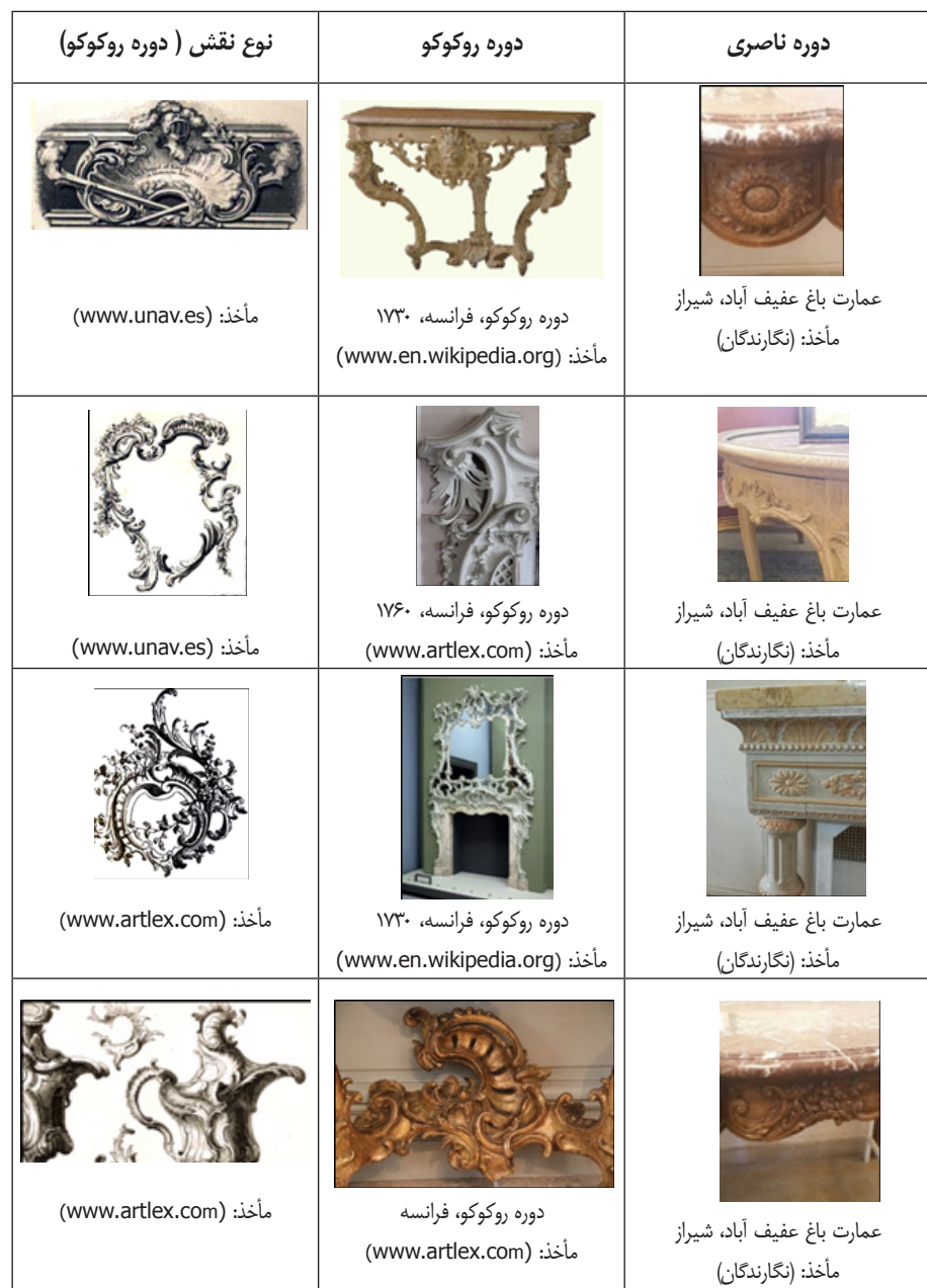
جدول ۲. تطبیق نقوش اسلیمی - رو کو کویی در صنعت مبلمان و تزئینات داخلی

تزئینات دوره رو کو کو الهام گیرند. در جدول متأخر مبنای تطبیق بر نقوش تلفیقی از اسلیمی ها تاکید دارد که در دوره رو کو کو رواج داشتند. این نقوش و تزئینات بیشتر جنبه سلطنتی و فاخر داشته و تهییج سفارش دهندگان را بر نمایش تمکن و اقتدارشان افزوده است. همانطور که ذکر شد، موارد استفاده نقوش اسلیمی - رو کو کویی در صنعت مبلمان و تزئینات داخلی دوره قاجار دوم آنقدر شیوع یافت که پس از چند دهه به صورت یک سنت هنری در میان صنعت کاران مبلمان پذیرفته شد.