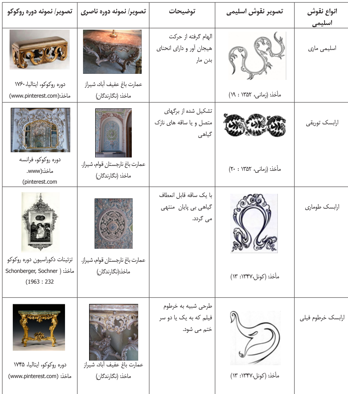
جدول ۱. تطبیق نقوش اسلیمی رو کو کویی

صورت‌های مختلف به ظهور درآمده است. ترکیب شمسه که نمادی از خورشید است با نقوش اسلیمی در دوره رو کو کو کاربرد وسیعی در تزئینات نقوش دارد و در دوره ناصری نیز همچنین. نقش مایه شمسه یکی از نقوش اصلی و مهم در تمامی بناهای مهم دوران قاجار است (کیایی، ۱۳۹۲: ۲). اسلیمی شکوفه‌سان با ترکیب طرح‌های گلدار و استلیزه شده از شکل‌های گل لاله، سنبل، گل سرخ و میخک، از نقوشی است که کثرت و تنوع فرم دارد و با پیچ و تاب‌ها و به صورت‌های گوناگون در نقوش مبلمان و تزئینات داخلی بنا کاربرد یافته است. این نقوش اسلیمی در جدول شماره یک با ارائه نمونه‌هایی از دوره ناصری و دوره رو کو کو مورد تطبیق قرار گرفته است.