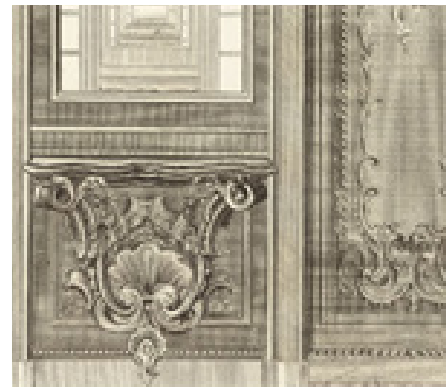
تصویر ۳. تزئینات دکوراسیون دوره رو کوکوبا کاربرد نقوش اسلیمی، ماخذ: (Schonberger 323 :1963)