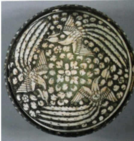
تصویر ۱۵. احتمالاً کاشان، اواخر قرن ۱۳ و ۱۴ م. العز الاقبال... العز الاقبال... الامر (ا) النا (ا) فذ النا (ا) فذل العز الاقبال... مأخذ: (Watson, 2006: 385)