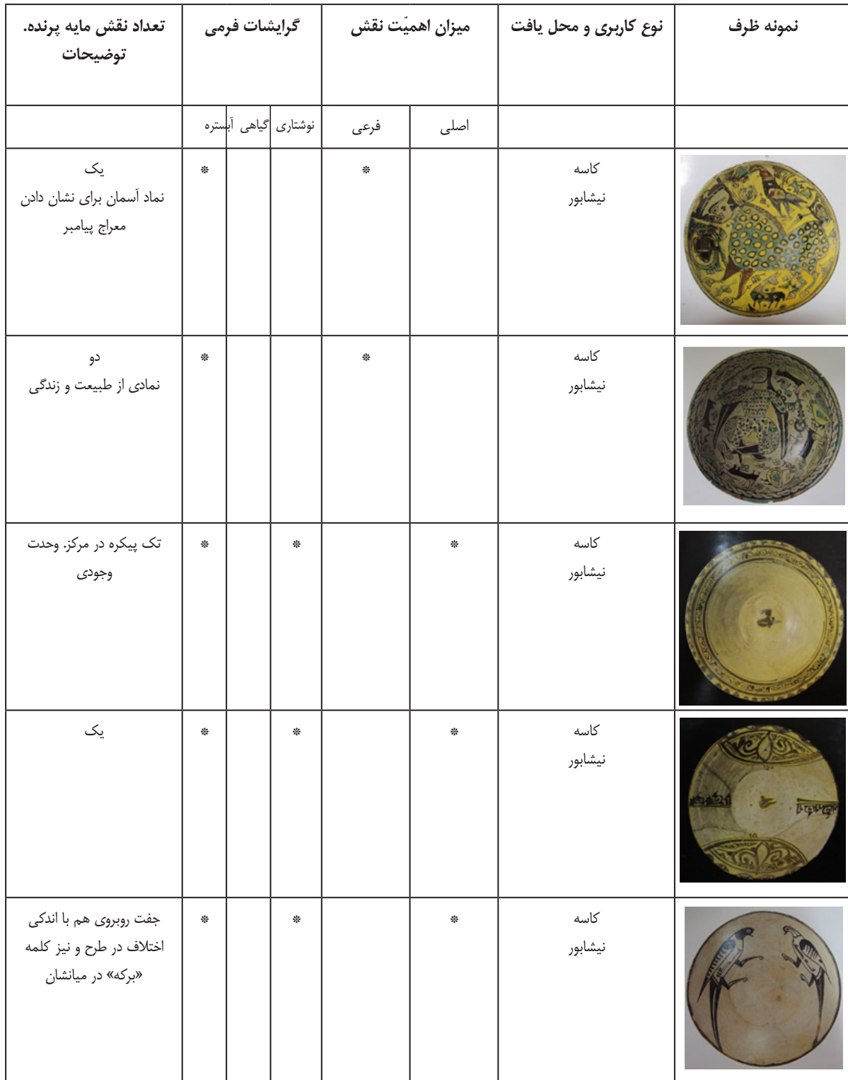
جدول شماره ۰۱. بررسی گرایش‌های فرمی