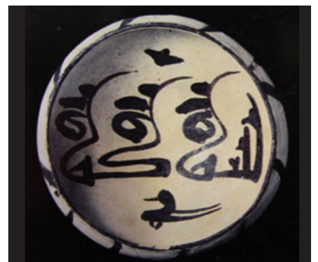
تصویر ۶. کاسه، ایران، نیشابور، قرن سوم و چهارم هجری