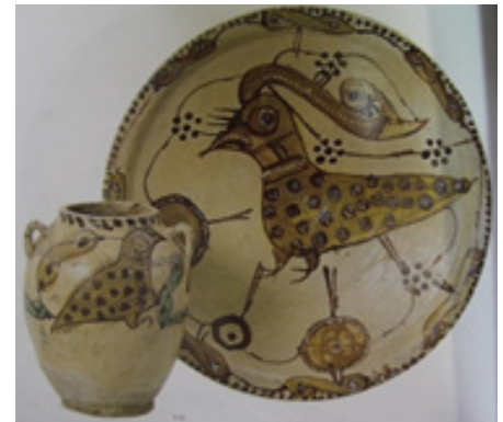
تصویر ۱۳. کوزه و بشقاب، ایران، مازندران، قرن سوم و چهارم هجری، مأخذ: (خلیلی، ۱۳۸۴: ۱۰۱)

ظهور اسلام، تأثیر به‌سزای خط کوفی در نقوش پرندگان نیز به وضوح مشاهده می‌شود که به نوعی ادغام خط و نقاشی یا نوعی خط نگاره محسوب می‌شود. علاقه‌ی ایرانیان به رمزنگاری، رمزپردازی و نمادگرایی در ادبیات قبل و بعد از اسلام نیز عامل مهمی در استفاده از نقش پرنده به منظور تزئین ظروف سفالین شمرده می‌شود. آنچه که مشخص است نقش پرنده اهمیت زیادی در تزئینات سفال دوران سامانی داشته است. با این حال رویکرد سفالگر نسبت به ترسیم پرندگان متفاوت بوده است؛ چنان که هنگامی که پرنده در نقش فرعی ایفای نقش می‌کند، نقش نمادین آسمان و پرواز را بر عهده دارد؛ حال آن که هنگامی که پرنده در نقش اصلی ظاهر می‌شود، وجوه نمادین کمتر و جنبه‌ی تزئینی آن بیشتر می‌گردد. با وجود این نمی‌توان تخیل هنرمند را در این تصویرگری نادیده گرفت. رویکرد کلی هنرمند در تصویرگری پرنده در این دوران، به سه دسته کلی تقسیم شد که شامل گرایش به خط کوفی، گرایش به تزئینات گیاهی و تخیل صرف هنرمند می‌شد. عامل دیگری که در این نقش آفرینی، مؤثر واقع شده غیر از دوره‌ی تاریخی موجود سبک منطقه‌ای است که هنرمند در آن زندگی است؛ چنان که در سفالینه‌های شهر نیشابور، عموماً پرندگان قسمت کوچکی از ظرف را می‌پوشانده‌اند؛ ولی در نواحی شمالی چون گرگان، پرنده کل فضای اثر را به خود اختصاص داده است. با اینکه عموماً خطوط و نقاشی سفال‌گران ایرانی رها بوده و روح سفال‌گر در آن جاریست؛ ولی در سفالینه‌های نیشابور شاهد قید و بندهای ذهنی سفال‌گر برای ترکیب‌بندی و تعالی اثر در بهترین حالت ممکن هستیم؛ در حالی که در سفال‌های یافت شده در منطقه‌ی مازندران و گرگان، پرنده‌های کاملاً تجریدی بر پایه‌ی تخیل هنرمند و در نهایت آزادی تفکر ترسیم شده‌اند.