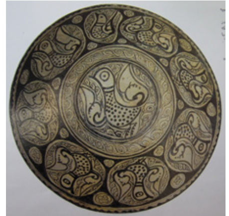
تصویر ۵. کاسه، ایران، نیشابور، قرن سوم و چهارم هجری، مأخذ: (خلیلی، ۱۳۸۴: ۸۴)

از دیگر گرایشات تزئینی پرندگان در دوران سامانی، گرایش به سمت نقوش گیاهی و نباتی است. در بعضی آثار، نقوش به گونه‌ای با زمینه‌ی گیاهی ادغام شده است که تشخیص آن دشوار است. ظرفی که در تصویر ۱۰ نمایش داده شده، نمونه‌ی بارز این ادغام است. نقوش ترکیبی از طرح‌های تزئینی مختلف است که در الگوی متراکمی گنجانده شده و تقریباً تمامی سطح ظرف را پوشانده است. یک قاب گرد در وسط کاسه نوشته‌ی کوتاهی دارد که بالای آن یک پرنده‌ی آبستره با بال‌های گشوده دیده می‌شود که حالت پرواز را تداعی می‌کند؛ همانند دیگر سفال‌های سامانی، بال‌های پرنده به شکل نخلک است. یک سری پرنده‌ی ایستاده با پاهای بلند و دم‌هایی