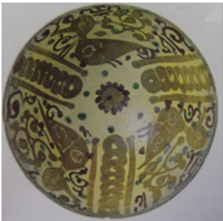
تصویر ۱۱، بالا. کاسه، ایران، احتمالاً نیشابور، قرن سوم و چهارم هجری، مأخذ: (خلیلی، ۱۳۸۴: ۹۶). تصویر پایین. کاسه، ایران، احتمالاً گرگان، قرن سوم و چهارم هجری (همان: ۹۴).

بی‌شک حرمت تصویرگری در اسلام واقعیتی انکار ناپذیر در اجتناب از واقع‌گرایی در مصورسازی پرندگان در دوران سامانی است؛ به علاوه به دلیل نزدیکی زمانی ترسیم این نقوش به ابتدای