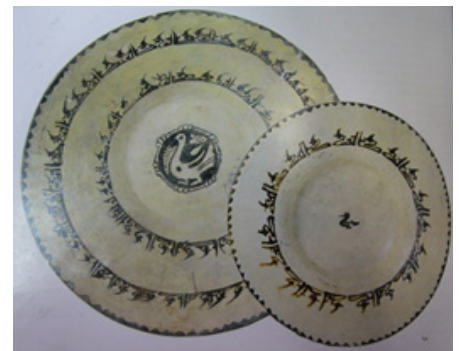
تصویر ۷. کاسه، ایران، نیشابور، قرن سوم و چهارم هجری مأخذ: (خلیلی، ۱۳۸۴: ۹۱)