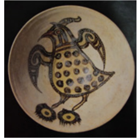
تصویر ۱۲. کاسه، ایران، احتمالاً مازندران، قرن سوم هجری، مأخذ: (خلیلی، ۱۳۸۴: ۹۸)