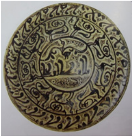
تصویر ۱۰. کاسه، ایران، نیشابور، قرن سوم و چهارم هجری، مأخذ: (خلیلی، ۱۳۸۴: ۹۳)