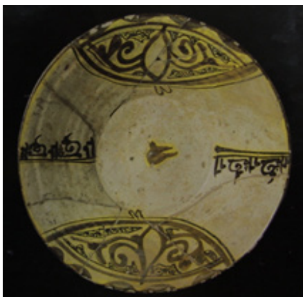
تصویر ۳. دوکاسه. ایران. نیشابور. قرن سوم و چهارم هجری

نمونه‌ای از ظروفی که پرنده در نقش مکمل قرار گرفته، تصویر شماره‌ی یک است. به احتمال زیاد این چهارپا با سر انسانی که در این کاسه نقاشی شده است همان بوراک است، اسب توسن مرموزی که حضرت محمد را در معراج شبانه‌اش به هفت طبقه بهشت و جهنم همراهی کرده است. (خلیلی، ۱۳۸۴: ۴۹) نقش پرنده و نحوه‌ی قرارگیری‌اش در بالای ظرف (که در تقابل با نقش بزی است که در پایین ترسیم شده)، نمادی از آسمان و طبقات بالای آسمانی است.