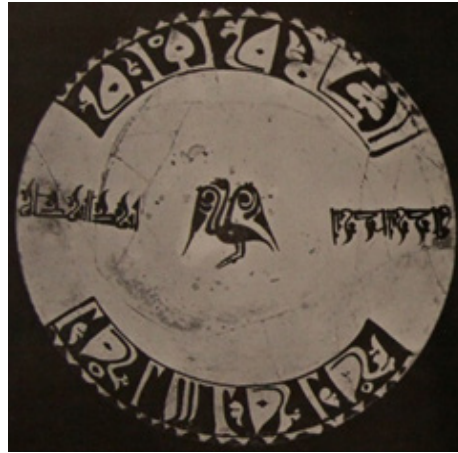
تصویر ۹. قدح / موزه آبگینه و سفالینه‌های ایران / نیشابور / برکه و یمن و سرور (برکت و میمنت و شادی). کلمه‌ی برکه چهار بار روی قدح تکرار شده است، مأخذ: (قوچانی، ۱۳۶۴: ۱۸۶).