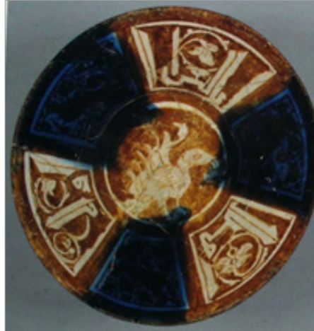
تصویر ۱۴. کاسه بدنه خمیر شیشه، تزئین زرین فام. ایران، کاشان. نوشته داخلی: العز/الاقبال/بدنه خارجی: الع [ ز ] و الاقبال [ و ] و الدوله و السعاده و السل [ امه. مأخذ: (Watson, 2006: 350)