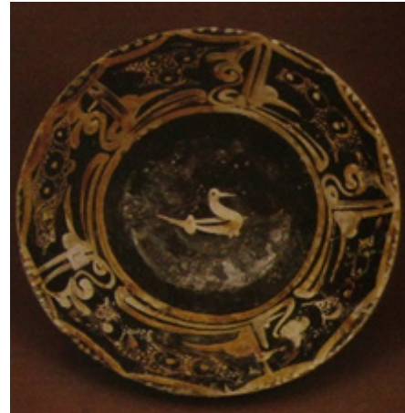
تصویر ۸. بشقاب / موزه‌ی ایران باستان / نیشابور قرن ۴ هـ.ق متن: برکه ۵ بار تکرار شده، مأخذ: (قوچانی، ۱۳۶۴: ۶۸).