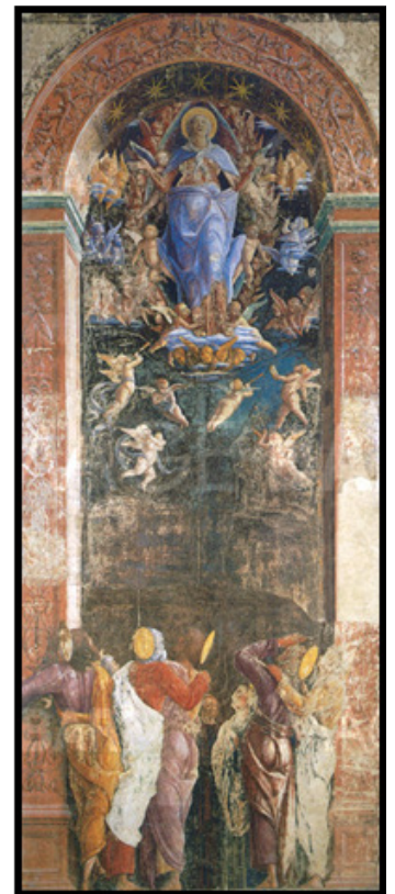
تصویر ۱: فرسک بر محراب آرامگاه شخصی، آندریا منتگنا (بریتانیکا، ۱۴۷۴).

بدین ترتیب، زمانی که سرزنش مؤلفان به خاطر نوشته‌هایشان آغاز شد یعنی زمانی که یک متن می‌توانست خاطی باشد پیوند میان مؤلف و متن به‌طور جدی بنیاد نهاده شد. در این زمان نوشته به نوعی دارایی شخصی در مالکیت مؤلف تبدیل گردید و نظریه‌ی انتقادی شکل گرفت