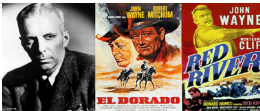
تصویر ۴: پرتره‌ی هاوارد هاکس و پوستره‌های دیزاین شده برای فیلم‌های ال دورادو و رودخانه‌ی سرخ (فیلم پررویشین، ۱۹۹۵-۱۹۴۸).