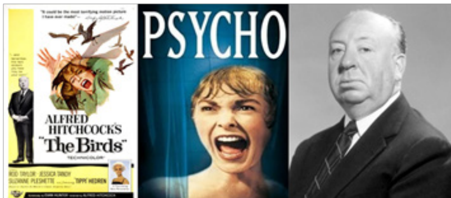
تصویر ۳: پرتره‌ی آلفرد هیچکاک و پوستره‌های دیزاین شده برای دو فیلم پرندگان و روانی (فیلم پررویشین، ۱۹۶۳-۱۹۶۰).

دوفصل نامه، دانشکده هنر؛ دانشگاه شهید چمران اهواز دیزاین تألیفی و دیزاینر مؤلف دوره چهارم، شماره هفتم - سال ۹۴ ۱۷