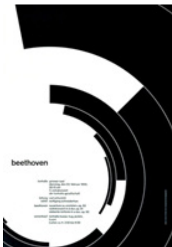
تصویر ۲: پوستر فستیوال موسیقی تون‌هال زوریخ، دیزاینر مولر براکمان (تایپوگرافی، ۱۹۵۵).

کتاب مرگ مؤلف بارت در پاریس، در سال ۱۹۶۸ نوشته شد؛ سالی که دانشجویان، در یک اعتصاب عمومی، در سنگرها به کارگران پیوستند و جهان غرب با یک انقلاب اجتماعی حقیقی