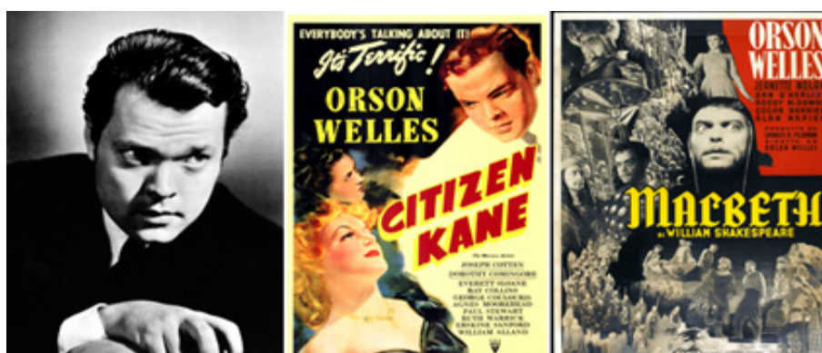
تصویر ۵: پرتره‌ی اورسن ولز و پوستره‌های فیلم‌های همشهری کین و مکبث (فیلم پررویشین، ۱۹۴۸-۱۹۴۱).

باید مفهوم مؤلف را به‌عنوان یک ابزار برای ارتقای آن چیزی شکل می‌دادند که در عرصه‌ی بلندمرتبه‌ی هنرهای زیبا، یک سرگرمی بی‌ارزش تلقی می‌شد. شباهت‌های میان کارگردانی سینما و حرفه‌ی دیزاین قابل توجه است؛ کارگردان هنری یا دیزاینر نیز مانند کارگردان سینما، با مدیریت فعالیت عده‌ی دیگری از افراد خلاق، اغلب از ماده‌ای که با آن کار می‌کند، دور نگاه