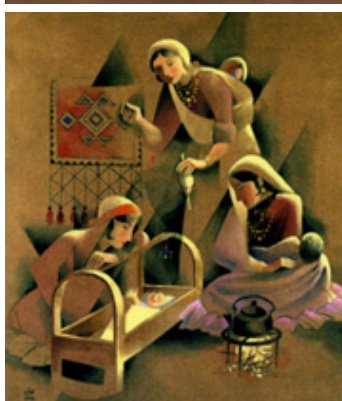
تصویر شماره ۲-۳-۴-۵،