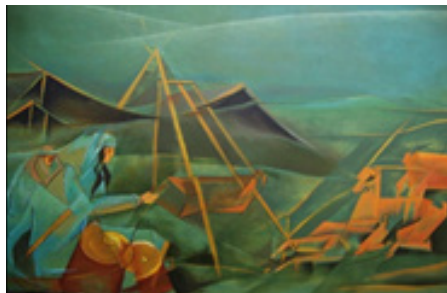
تصویر شماره ۱۲، عنوان اثر: مشکدو، نقاش: بختیار سامه، سال خلق اثر: ۱۳۹۱، تکنیک: اکریلیک. زنان برای تبدیل ماست به دوغ آن را در «مشکدو» می‌کنند و مدتی تکان می‌دهند.