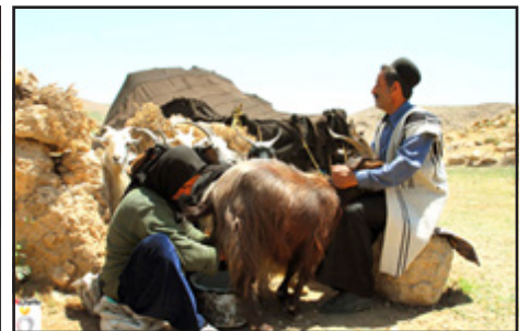
تصویر شماره ۱- تصاویری از زنان بختیاری و فعالیت مستمر روزانه آنها در عشاير بختیاری خوزستان - ایذه