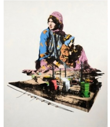
تصویر شماره ۶، عنوان اثر: نفت و رنج (مجموعه برف شادی) نقاش: امین روشن سال خلق اثر: ۱۳۹۲ تکنیک: اکریلیک و نقاشی با نفت خام بروی پارچه، سیلک اسکرین.

درست است که زنان در این قوم به دلیل حجم بسیار از کارهای روزانه، حتی تنهایی‌شان را