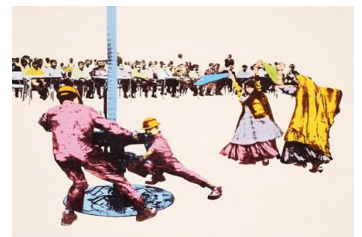
تصویر شماره ۷ عنوان اثر: کفش‌های قرمز (مجموعه برف شادی) نقاش: امین روشن سال خلق اثر: ۱۳۹۲ تکنیک: اکریلیک و نفت با استفاده از سیلک اسکرین بر روی بوم. همان منبع.