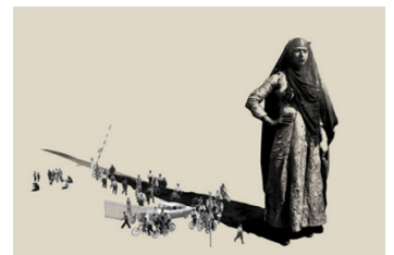
تصویر شماره ۸ عنوان اثر: زن بختیاری (مجموعه برف شادی) نقاش: امین روشن سال خلق اثر: ۱۳۹۲ تکنیک: اکریلیک و نفت با استفاده از سیلک اسکرین بر روی بوم. همان منبع.