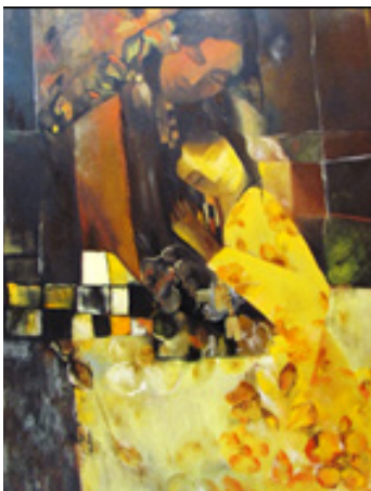
تصاویر شماره ۱۳-۱۴-۱۵ عنوان اثر: بانوی بختیاری، نقاش: ثریا ابدالی راد، سال خلق اثر: ۱۳۹۵، تکنیک: رنگ و روغن.