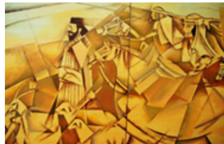
تصویر شماره ۱۱، عنوان اثر: کوچ، نقاش: بختیار سامه، سال خلق اثر: ۱۳۹۱، تکنیک: اکریلیک.