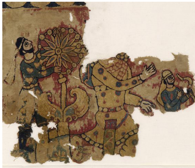
Image 2 Fragments of a Wall Hanging 6–7th AD Benaki Museum Athens.