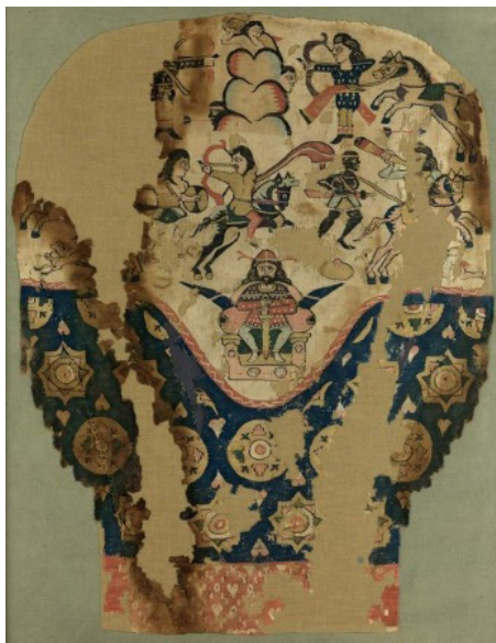
Image 1 Coptic textile fragment of legging Antinoe, 6–7th AD Musée des Tissus, France.

After a brief review of the iconography approach, this article describes the status of textile during the Sasanian period. It then relies on a developmental theory about the iconological interpretation of these textile motifs and explores two pieces of Sassanid fabric based on the dominant forms of that era. After review and exploring two pieces of Sassanid fabric, It shows that the purpose of producing these motifs is to induce concepts such as supernatural power and immortality for the royal force and the king himself, and the two pieces of fabric display Zoroastrian beliefs symbolically in order to legitimize sovereignty. Finally, the results are presented in a table below.