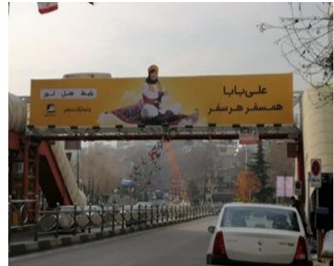
تصویر ۳. تبلیغ تجاری برای شرکت مسافرتی در تهران ۱۳۹۸.

۴. سایت خرید و فروش خودرو: سبک این تبلیغ (تصویر ۴) مینیمالیسم واقع‌گرا است. در این تبلیغ، از کمترین عناصر بهره گرفته شده و با بیانی ساده و صریح، پیام را به مخاطب منتقل می‌کند. ترکیب‌بندی مرکزی و قرینه است. تکنیک به کار رفته، عکاسی واقع‌گرا می‌باشد؛ همچنین تمرکز بر رنگ (زرد) هویت سازمانی سایت در عکس ماشین و متن‌های نوشته شده، بر زمینه سیاه رنگ موجب وحدت در عناصر تجسمی شده است. طرح نوشتار (تایپ فیس) در لوگو سان‌سریف و در عنوان برای خوانایی و وضوح بیشتر، به صورت سریف‌دار ظاهر شده است. لازم به ذکر است، فونت سریف‌دار از لحاظ خوانایی، آسان‌تر از فونت‌های سان‌سریف می‌باشد. فونت‌هایی که فرم فانتزی دارند و همچنین فونت‌هایی که به صورت مونولاین یا به صورت دستی اجرا شده باشند، فونت‌های اسکرپیت و سان‌سریف می‌باشند.