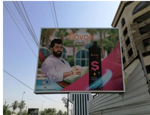
تصویر ۷. تبلیغ تجاری محصول مراقبت از مو در بغداد ۱۳۹۹.

۲. مجتمع تجاری: سبک این تبلیغ (تصویر ۸) از نظر رنگ و فرم کاراکترها به نوعی فانتزی و تخیلی است. ترکیب بندی در این تبلیغ به صورت مرکزی ارائه شده است؛ همچنین از عناصر و رنگ‌های غیر ضروری دوری شده تا با کمترین مؤلفه‌ها یک تبلیغ مؤثر خلق شود. این تبلیغ با تکنیک تصویرسازی و با ساده‌سازی کاراکترها در ترکیب بندی اثر به چشم مخاطب این امکان را می‌دهد که به صورت پی‌درپی در بین عناصر حرکت کند؛ همچنین خط منحنی در تصویر با فرم نوشتاری همخوانی دارد.