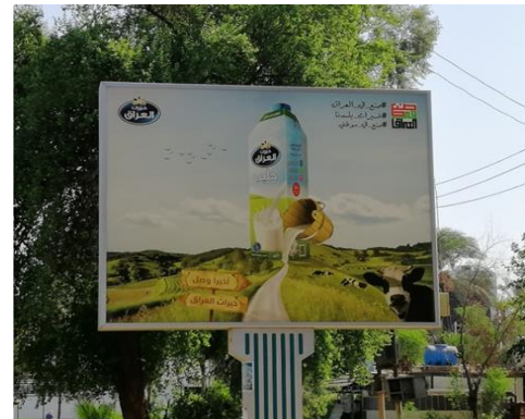
تصویر ۱۱. تبلیغ تجاری محصول غذایی در بغداد ۱۳۹۹.

۶. محصول پاک‌کننده: سبک این تبلیغ (تصویر ۱۲) واقع‌گرایانه با عکاسی از محصول و خانمی که آنرا تبلیغ می‌کند اجرا شده است. رنگ آبی زمینه، در کنتراست با رنگ سفید (قوطی مواد پاک‌کننده...) ضمن ایجاد درخشندگی رنگ و جلب نگاه مخاطب، حس تمیزی را القا می‌کند. ترکیب‌بندی عناصر در دوسطح جلوتر و شامل مواد پاک‌کننده و خط افق دوم خانمی که آنرا معرفی می‌کند، دارای اندکی عمق میدان است. لوگوی محصول در بالای تبلیغ، نقطه اهمیت و تمرکز است و از طریق فرم، رنگ و شکل نوشتار موقعیت نمادین یافته است. توجه بصری در این تبلیغ بر اساس شیوه خواندن که حرکت چشم از راست به چپ می‌باشد، اعمال شده است؛ به طوری که نگاه مخاطب از سوئی به سوی دیگر هدایت می‌شود.