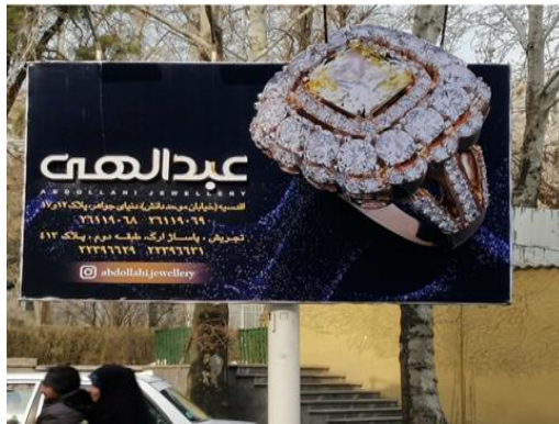
تصویر ۶. تبلیغ تجاری فروشگاه جواهرات در تهران ۱۳۹۸.

و رودررو نمایش داده شده است. رنگ محصول واقعی و بدون تغییر نشان داده شده است. در مورد ساختارهای متنی، می توان گفت خطوط تشکیل دهنده، خطوطی غیر هندسی و اسکرپیت هستند که با دست اجرا شده و از شکل فونت لوگوی محصول اخذ شده است.