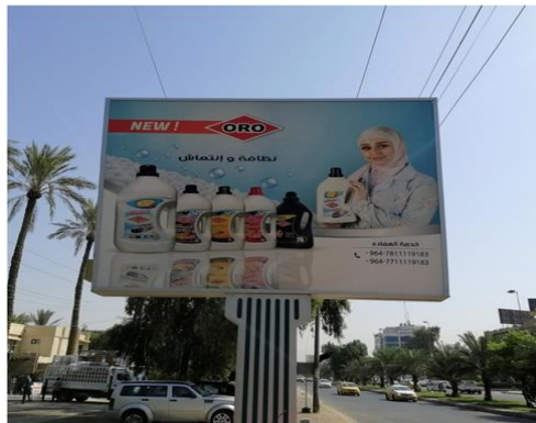
تصویر ۱۲. تبلیغ تجاری محصول تمیز کننده در بغداد منبع: نگارندگان. ۱۳۹۹.

۵. محصول غذایی ( شیر پاکتی ): سبک به‌کار رفته در این تبلیغ (تصویر ۱۱) واقع‌گرایانه افراطی است که در وسط، تصویر بزرگ محصول (شیر پاکتی) با جزئیات واضح، بیانگر ایده تبلیغ است؛ همچنین تمام عناصر (از مزرعه و گاو و شیر پاکتی و...) در صحنه‌ای واقع‌گرایانه اما در ابعاد و تناسبات خیالی ارائه شده است. تکنیک به‌کار رفته فتومونتاژ است. محصول شیر پاکتی در وسط تصویر در قیاس با دیگر عناصر با ابعاد و تناسباتی اغراق آمیز، سبب جذب نگاه مخاطب است. نوشتار با فونت‌های متنوع با یکدیگر متفاوت هستند؛ برخی از آن‌ها سنتی و با دست اجرا شده‌اند و برخی دیگر از فونت لوگوی محصول اخذ شده‌اند. طراحی این تبلیغ با تمرکز بر روی محصول و دو برابر کردن ابعاد آن، به تعریف محصول پرداخته است.