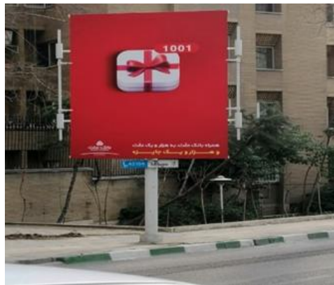
تصویر ۲. تبلیغ تجاری بانک ایرانی (بانک ملت) در تهران

۱. مرکز فروش فرش: سبکی که در این تبلیغ (تصویر ۱) به کار رفته، سبک واقع‌گرا به صورت بیان حالت می‌باشد؛ جایی که ما آن را از طریق گویایی رنگ قرمز، فرم نوشتار و بیان حالت در عکس متوجه می‌شویم. برای جلب توجه مخاطب در ساختار اصلی تبلیغ، از عکس واقع‌گرایانه که به پیام و نوشته تبلیغ با دست اشاره کرده استفاده شده است. نوشته در قاب قرمز، در جهت تاکید بر لوگوی شهر فرش قرار دارد. همچنین شاهد دوگانگی در فرم نوشتار هستیم؛ فرم نوشتار سنتی خط نسخ که در شکل اصلی آن با سریف در نظر گرفته می‌شود، در عنوان جهت سهولت در خوانایی به و در تناسب با طراحی حروف لوگو بدون سریف، کار شده است. سبک موجود در این تبلیغ، مستقیماً بر مخاطب تأثیر می‌گذارد و حالت پیام تبلیغاتی را تا حد ممکن واضح و صریح بیان می‌کند. ترکیب‌بندی در این تبلیغ، به صورت چرخشی و به روشی ساده؛ تصویر مرد جوان را در زاویه سمت چپ قرار داده که با انگشت به سمت و مرکز و سپس به شعار تبلیغ هدایت می‌کند. همچنین رنگ عکس و متن دارای کنتراست بالا است. رنگ قرمز همان رنگ هویت سازمانی محصول است؛ به عبارتی به جای توضیح و متن بیشتر در مورد کالا، بر رنگ قرمز که رنگ لوگوی شهر فرش است تاکید شده است.