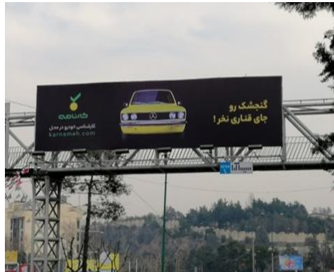
تصویر ۴. تبلیغ تجاری سایت خرید و فروش خودرو در تهران ۱۳۹۸.

۳. شرکت مسافرتی علی بابا: سبکی که در این تبلیغ (تصویر ۳) به کار رفته، سبک سورئالیستی یا خیال‌پردازانه می‌باشد و طراح شخصیت تخیلی داستان علی بابا را بر روی قالی پرنده معلق در فضا را نشان می‌دهد. در مرکز یک کادر افقی، شاهد تصویر نمادینی از علی بابا که در ضمن نام شرکت مسافرتی است دیده می‌شود. تکنیک فتومونتاژ تجسم پرواز علی بابا را با فرش پرنده را در فضایی سورئالیستی بخوبی نمایش داده است. از لحاظ رنگ، ملاحظه می‌کنیم که رنگ غالب در این تبلیغ، زرد است. اگر عناصر تبلیغ را به دقت بررسی کنیم، به نظر می‌رسد که هریک از عناصر با مرجع خود (شرکت مسافرتی علی بابا با رنگ سازمانی زرد) همپوشانی دارند.