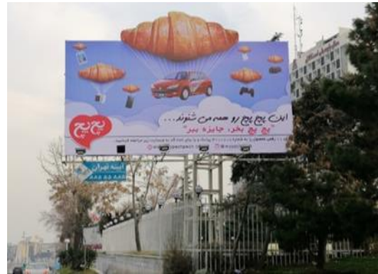
تصویر ۵. تبلیغ تجاری یک محصول غذایی در تهران ۱۳۹۸.

۶. فروشگاه جواهرات: سبک به کار رفته در این تبلیغ (تصویر ۶) واقع گرایانه افراطی است که در تصویر انگشتر بسیار بزرگ با جزئیات واضح و در رنگ های پرتالو و درخشان در کنتراست با زمینه به رنگ های سرمه ای و آبی، باعث جلب توجه مخاطب و اثربخشی تصویر شده است. این تبلیغ با تکیه بر دو تقسیم اساسی یکی برای ساختار تصویری (انگشتر) و دیگری برای ساختار متنی، انجام شده است. این امر، موجب ایجاد تعادل در فضای کلی تبلیغ شده است؛ در حالی که پس زمینه آبی، باعث ایجاد عمق در فضا است و عناصر تبلیغ را به سمت جلو سوق می دهد. تایپ فیس در لوگوی فروشگاه سریف دار سنتی و ترکیب بندی در این تبلیغ به صورت متقارن می باشد. تکنیک استفاده شده برای این تبلیغ، عکاسی می باشد. این نوع تکنیک موجب ایجاد هیجان فوری و مستقیم در مخاطب می شود.