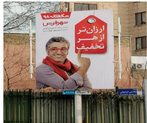
تصویر ۱. تبلیغ تجاری مرکز فروش فرش در تهران ۱۳۹۸. منبع: نگارندگان.

۲. بانک ملت: سبک استفاده شده در این تبلیغ (تصویر ۲) مینیمالیسم با لحنی بیانگر از لحاظ رنگ و شکل نوشتار می‌باشد. در این سبک، از عناصر و رنگ‌های غیرضروری اجتناب شده و برای ایجاد یک تبلیغ مؤثر، از کمترین عناصر بهره گرفته شده، همچنین ترکیب‌بندی این تبلیغ منظم و در مرکز است. یکی از جلوه‌های انتزاع در این تبلیغ، رنگ تخت و فاقد هرگونه تنالیت است. سوژه اصلی به صورت شکلی هندسی و با رنگی متضاد (سفید) در وسط کادر قرار گرفته و برای مخاطب، حس یک جعبه جادویی را تداعی می‌کند. این تبلیغ، با کمترین فرم و