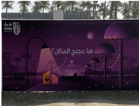
تصویر ۸. تبلیغ تجاری مجتمع تجاری تفریحی در بغداد ۱۳۹۹.