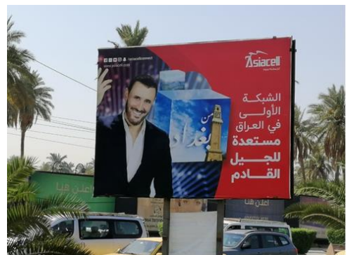
تصویر ۹. تبلیغ تجاری برای شرکت مخابراتی در بغداد ۱۳۹۹.