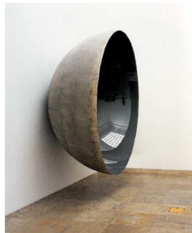
تصویر ۲. آینه چشم‌انداز خاکستری، آنیش کاپور (۲۰۰۷). منبع: اربابی، ۱۳۹۱، ص. ۶۴.