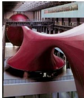
تصویر ۱. مارسایاس، آنیش کاپور (۲۰۰۶). منبع: بابا، ۱۳۹۱، ص. ۷۸.