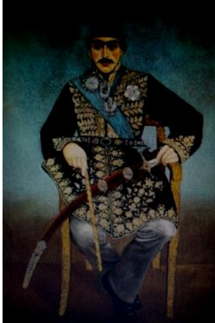
تصویر ۱۱. نقاشی از ولیعهد مظفرالدین شاه قاجار، منسوب به میرزا حسن خان، احتمالاً تبریز، ایران، ۷۱×۱۰۴ سانتیمتر، حدود ۸۰-۱۸۷۰، قیمت: حدود ۳۰۰۰۰ پوند در سال ۲۰۱۴ م.