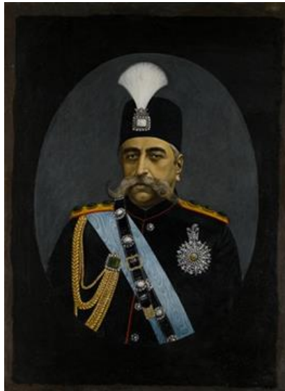
تصویر ۹. مظفرالدین شاه (۱۸۹۶-۱۹۰۷): ایران، قاجار، حدود ۱۹۰۰، شماره موزه‌ای: ۸۰۰۰-۱۲۰۰۰ GBP، رنگ و روغن روی بوم.