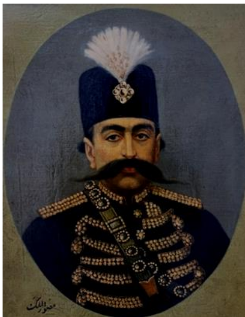
تصویر ۶. نقاشی از مظفرالدین شاه قاجار، ایران، با امضای نقاش سلطنتی «مصورالملک»، قیمت: ۱۰۵۰۰ پوند، ۱۲۰۱۰ دلار آمریکا، ۱۱۶۶۹ یورو، شماره موزه: ۸۷۰۷۱۳SA، تاریخ: قرن نوزدهم م، گالری. منبع: https://sellingantiques.co.uk .

مخصوص) در زمان مظفرالدین شاه قاجار بوده است. او در سال ۱۳۱۴ ه.ق لقب مصورالملک را دریافت کرد. آثار مشخص شده او بین سال‌های ۱۳۰۹ ه.ق/ ۱۸۹۱-۱۸۹۲ م و ۱۳۲۲ ه.ق/ ۱۹۰۴-۱۹۰۴ م است که بسیاری از آن‌ها در کاخ گلستان تهران نگهداری می‌شود (کریم‌زاده تبریزی، ۱۹۹۱، ج ۳، ص. ۱۲۴۷-۵۱). آثار او با تعبیر (جان‌نثار) بین سال‌های ۱۳۰۹ ه.ق/ ۱۸۹۱-۱۸۹۲ م و ۱۳۱۳ ه.ق/ ۱۸۹۵-۱۸۹۶ م، و عبارت «نقاش سلطنتی» (نقاش مخصوص) در فاصله سال‌های ۱۳۱۳ ه.ق/ ۱۸۹۵-۱۸۹۶ م. اگر این همان مهدی باشد، پس ممکن است این پرتره در سال ۱۳۱۳ ه.ق قبل از کسب عنوان مصورالملک در ۱۳۱۴ ه.ق/ ۱۸۹۶-۱۸۹۷ م کشیده شده باشد. با این حال، شاه به‌عنوان مردی بسیار جوان‌تر به تصویر کشیده می‌شود که شبیه ظاهر او در عکس‌های دهه ۱۸۷۰ م است https://christies.com