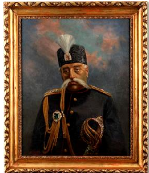
تصویر ۸. مظفرالدین شاه قاجار (۱۸۹۶-۱۹۰۷)، اثر سید حسین، معروف به «میرمصور»، شماره موزه‌ای: لات R1۰۹. ایران، ۶۴×۸ سانتیمتر، مورخ ۱۳۳۰ ه.ق/ ۱۹۱۱-۱۹۱۲ م.