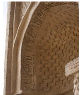
تصویر ۳. کتیبه چهل‌دختران دامغان با عبارت «الملک لله».

همچنین او به دنبال ارتباط و پیوند موضوع آیات قرآن با کاربری بنا می‌باشد. بر همین اساس آیات را بررسی نموده و به‌طور مثال به آیات ۷۸ و ۷۹ سوره «إسراء» اشاره کرده است: ترجمه آیات: نماز را از ابتدای تمایل خورشید به جانب مغرب [که شروع ظهر شرعی است] تا نهایت تاریکی شب بر پا دار، و [نیز] نماز صبح را [اقامه کن] که نماز صبح مورد مشاهده [فرشتگان شب و فرشتگان روز] است. و پاسی از شب را برای عبادت و بندگی بیدار باش که این افزون [بر واجب] ویژه توست، امید است پروردگارت تو را [به سبب این عبادت ویژه] به جایگاهی ستوده