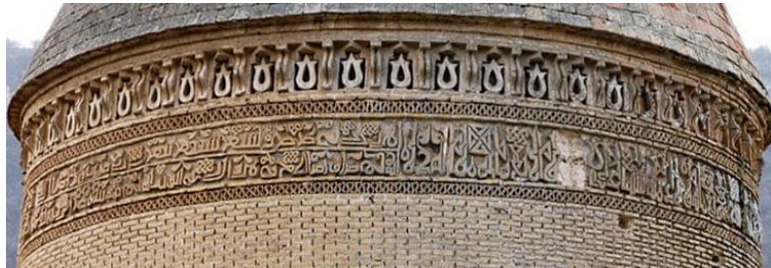
تصویر ۵. کتیبه خط پهلوی در کنار عربی برج رادکان شرقی.

کتیبه‌های احداثی و پایه‌گذاری بناها جایگاه تشریفاتی پایین‌تری داشتند، نفوذ کرد. بلر اولین مورد استفاده از زبان پارسی در کتیبه را یادگاری عضدالدوله در تخت جمشید معرفی می‌کند ۹ (بلر، ۱۳۹۴، ۵۲) (تصویر ۴). در واقع زبان پارسی نخست در کتیبه‌های پایه‌گذاری شرق ایران به کار رفته است و حتی از نیمه سده ششم/ دوازدهم در شرق ایران، کتیبه پارسی در ظروف و دیگر اشیا هم متداول شد. از سویی دیگر، در مناطق مستقل‌تر مانند اطراف دریای خزر که سنت‌های کهن‌تری برجای بود، خط پهلوی را در کنار خط عربی به کار می‌گرفتند و این آثار نخست منتسب به دوران ساسانی بود، اما اکنون متعلق به اوایل دوران اسلامی می‌دانند (بلر، ۱۳۹۴، ۲۴). کتیبه‌های دوزبانه در این مناطق به وفور یافت می‌شود؛ مانند «برج رادکان» (تصویر ۵)، «برج لاجیم»، «برج رسگت». بلر معتقد است ساختار کتیبه‌های پایه‌گذاری و کاربرد زبان و خط پهلوی همگی حاصل تقلید آگاهانه از بناهای کهن‌تر همین منطقه است و گویا در این مناطق دور از دسترس، سنت‌های پیش از اسلام تا میانه‌های دوران اسلامی همچنان زنده بوده است (بلر، ۱۳۹۴، ۲۵).