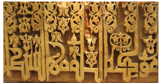
تصویر ۶. کتیبه کوفی مورق در مدرسه خرگرد خراسان.

در ادامه به بررسی پیدایش خط نسخ می‌پردازد و اشاره می‌کند بیشترین شواهد پیدایش خط نسخ را در یادگاری‌های حک شده در محوطه‌های هخامنشی پارس می‌مانند یادگاری عضدالدوله در سال ۳۴۴ هـ ق می‌توان یافت. با بررسی کتیبه‌ها طبق سیر تاریخی، در پایان سده پنجم هـ ق، تمام جریان‌های اصلی کتیبه‌نگاری ایران روشن می‌شود. گونه‌های اصلی کتیبه‌ها شامل یادگاری‌ها و کتیبه‌های احداثی بناهای گوناگون شامل مساجد و آرامگاه‌ها و کاخ‌ها و مناره و برج و بارو است؛ زبان رسمی کتیبه‌ها عربی بود، ولی افزایش اهمیت پارسی قابل