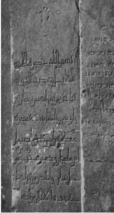
تصویر ۴. کتیبه یادگاری عضدالدوله در تخت جمشید، ۳۲۲ هـ.ق.

کتیبه‌های احداثی و پایه‌گذاری بناها جایگاه تشریفاتی پایین‌تری داشتند، نفوذ کرد. بلر اولین مورد استفاده از زبان پارسی در کتیبه را یادگاری عضدالدوله در تخت جمشید معرفی می‌کند ۹ (بلر، ۱۳۹۴، ۵۲) (تصویر ۴). در واقع زبان پارسی نخست در کتیبه‌های پایه‌گذاری شرق ایران به کار رفته است و حتی از نیمه سده ششم/ دوازدهم در شرق ایران، کتیبه پارسی در ظروف و دیگر اشیا هم متداول شد. از سویی دیگر، در مناطق مستقل‌تر مانند اطراف دریای خزر که سنت‌های کهن‌تری برجای بود، خط پهلوی را در کنار خط عربی به کار می‌گرفتند و این آثار نخست منتسب به دوران ساسانی بود، اما اکنون متعلق به اوایل دوران اسلامی می‌دانند (بلر، ۱۳۹۴، ۲۴). کتیبه‌های دوزبانه در این مناطق به وفور یافت می‌شود؛ مانند «برج رادکان» (تصویر ۵)، «برج لاجیم»، «برج رسگت». بلر معتقد است ساختار کتیبه‌های پایه‌گذاری و کاربرد زبان و خط پهلوی همگی حاصل تقلید آگاهانه از بناهای کهن‌تر همین منطقه است و گویا در این مناطق دور از دسترس، سنت‌های پیش از اسلام تا میانه‌های دوران اسلامی همچنان زنده بوده است (بلر، ۱۳۹۴، ۲۵).