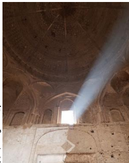
تصویر ۲. گنبد نظام‌الملک مسجد جامع اصفهان.

بناها می‌رسد: «ساختار تمام این کتیبه‌ها چنین است: سرآغاز، فعل، اسمی که معرف بناست، نام بانی یا حامی، تاریخ. گاهی نام فرمان‌روای زمان پس از نام بنا می‌آید و گاهی نام استادکار به پایان کتیبه افزوده می‌شود» (بلر، ۱۳۹۴، ۱۶). او معتقد است که شناسایی این اصول و قواعد رسمی در تشخیص و بررسی اختلافات سودمند است. سپس به فعالی که در این دسته‌بندی رایج بودند پرداخته است و اشاره می‌کند فعل رسمی در نخستین کتیبه‌های اسلامی ایران «امر ببناء» (فرمان داد به ساخت) است. فعل دیگر «عَمَرَ» می‌باشد که او معتقد است این فعل برای آباد کردن بنا مورد استفاده قرار می‌گرفت. این فعل (امر بعمار) را در کتیبه‌های مختلفی از آثار می‌توان مشاهده کرد از جمله قسمتی از کتیبه لوح چوبی آرامگاه امام علی (ع) در نزدیکی کوفه (نجف) که یکی از مهمترین اقدامات عضالدوله در سال ۳۶۳ هـ ق است (تصویر ۱). متن کتیبه: امر بعماره بقعه الشریفه تاج الملله الشاهنشاه ابی شجاع فناخسرو و لا زال عضالدوله سنه ثلث و ستین و ثلث مائه. ترجمه: تاج الملله شاهنشاه ابوشجاع فناخسرو که همچنان بازو و یاور حکمت بماناد به آباد کردن بقعه گرامی او فرمان داد در سال ۳۶۳ هـ ق (بلر، ۱۳۹۴، ۶۸-۶۹).