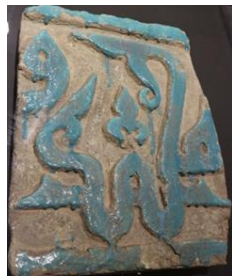
تصویر ۷. کتیبه نام محمد (ص)، محل کشف جرجان (گنبد کاووس)، قرن ۴ هـ. ق، موجود در موزه ملی ایران.