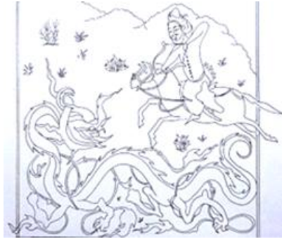
شاهنامه ۷۷۲ ه.ق

حالت تمرکز را ایجاد کرده دیده می‌شود. پویایی و حرکت، فضا سازی باز، توجه به فضای تنفس و حفظ ارتباط عناصر اصلی در این تصویر مشاهده می‌شود (تصویر ۱۶).