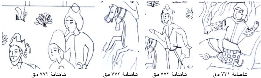
تصویر ۱۴. طرح خطی و جزئیات فیگورها در مجلس ۴ (بر آتش گذشتن سیاوش).

مجلس ۵. نگاره داستان کیخسرو پسر سیاوش در شاهنامه ۷۳۱ ه.ق با ترکیبی از رنگ‌های گرم به صورت غالب و مقداری رنگ سرد به تصویر کشیده شده و کادر تصویر به صورت پلکانی قرینه در دو طرف، به صورتی که شخصیت اصلی با فیگور بزرگتر در مرکز تصویر قرار گرفته است. تزیینات تخت و البسه شاه بیش از اطرافیان مد نظر نگارگر بوده است. مقداری از عناصر طبیعی در زمینه تصویر دیده می‌شود. این نگاره در شاهنامه ۷۹۶ ه.ق دوره آل مظفر، تزیینات عناصر طبیعی در زمینه کار و همچنین تجملاتی بودن تخت پادشاهی در مرکز تصویر جلب توجه می‌کند. کادر پلکانی در قسمت بالای نگاره فضای تنفس عالی در تصویر ایجاد کرده است. البسه افراد موجود در نگاره، ساده و فاقد تزیینات اضافی می‌باشد. سرپوش‌های تقریباً متفاوت از نظر رنگی احتمالاً نشان‌دهنده تفاوت مقام می‌باشد. جهت چرخش سرها و نگاه به طرف مرکز افراد نوعی توجه به مرکز را القا می‌کند. حالات عاطفی به دلیل مخدوش شدن چهره‌ها مشخص نمی‌باشد (تصویر ۱۵).