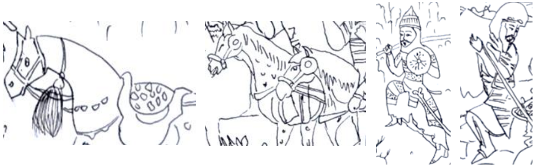
شاهنامه ۷۷۲ ه.ق

شخصیت پهلوان در نیمی از کادر انجام شده و باعث به وجود آمدن نوعی انسجام در نگاره شده است. کادر تصویر به صورت افقی در کل عرض صفحه به نمایش درآمده است. چهره‌ها بدون حالات هیجانی و عاطفی خاص و پیکره نگاری قراردادی و جامگان انسانی و ادوات جنگی با جزئیات تصویر شده است. این نگاره در شاهنامه ۷۷۲ ه.ق دارای طبیعتی پر از عناصر تزیینی، گل و گیاه و درختچه‌های بسیار و همچنین تپه‌های گرد می‌باشد. اختصاص قسمت بالای نگاره به آسمان ابری و دقت در جزئیات لباس، کلاه خود و زین اسب در حالت قراردادی و مغولی جلب توجه می‌کند. قرار گرفتن پیکره پهلوان در قسمت وسط نگاره با رنگ گرم بر روی زمینه‌ای از رنگ سرد مد نظر است. بیرون زدگی قسمتی از منظره، از سمت راست، شایان ذکر است. کیفیت رنگی خوب بدون سایه روشن و همچنین عدم رعایت تناسب انسانی از ویژگی‌های این نگاره می‌باشد (تصویر ۱۳).