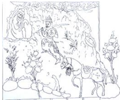
شاهنامه ۷۷۲ ه.ق

مجلس ۳. در نگاره «کاموس کشانی» در شاهنامه ۷۳۱ ه.ق ترکیب بندی قرینه در عین بی قرینگی و همچنین قرار گرفتن شخصیت اصلی بر روی نقطه طلایی مشهود است. ارتباط عناصر اصلی در این نگاره حفظ شده و به علت بزرگی فیگورها و تصاویر فضای تنفس بسیار کمی برای زمینه دیده می شود (تصویر ۵). این نگاره در شاهنامه ۷۷۲ ه.ق دارای ترکیب بندی قرینه با محوریت در مرکز نگاره می باشد؛ همچنین وجود فضای تنفس عالی کاملاً مشهود است. ترکیب عناصر اصلی بر روی قطر نگاره بوده و این ترکیب پویا حرکتی رو به بالا را القا می کند. کیفیت ناب خط، رنگ و اجرا، همچنین خطوط دورگیر مد نظر می باشد (تصویر ۱۸).