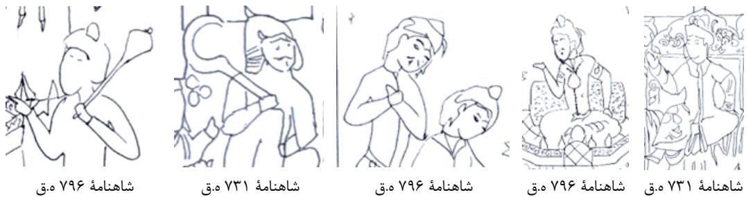
تصویر ۱۵. طرح خطی جزئیات مجلس ۵ (داستان کیخسرو پسر سیاوش).

مجلس ۵. نگاره داستان کیخسرو پسر سیاوش در شاهنامه ۷۳۱ ه.ق با ترکیبی از رنگ‌های گرم به صورت غالب و مقداری رنگ سرد به تصویر کشیده شده و کادر تصویر به صورت پلکانی قرینه در دو طرف، به صورتی که شخصیت اصلی با فیگور بزرگتر در مرکز تصویر قرار گرفته است. تزیینات تخت و البسه شاه بیش از اطرافیان مد نظر نگارگر بوده است. مقداری از عناصر طبیعی در زمینه تصویر دیده می‌شود. این نگاره در شاهنامه ۷۹۶ ه.ق دوره آل مظفر، تزیینات عناصر طبیعی در زمینه کار و همچنین تجملاتی بودن تخت پادشاهی در مرکز تصویر جلب توجه می‌کند. کادر پلکانی در قسمت بالای نگاره فضای تنفس عالی در تصویر ایجاد کرده است. البسه افراد موجود در نگاره، ساده و فاقد تزیینات اضافی می‌باشد. سرپوش‌های تقریباً متفاوت از نظر رنگی احتمالاً نشان‌دهنده تفاوت مقام می‌باشد. جهت چرخش سرها و نگاه به طرف مرکز افراد نوعی توجه به مرکز را القا می‌کند. حالات عاطفی به دلیل مخدوش شدن چهره‌ها مشخص نمی‌باشد (تصویر ۱۵).