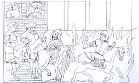
شاهنامه ۷۳۱ ه.ق

تصویر ۱۹. طرح خطی مجلس ۴ (بر آتش گذشتن سیاوش).