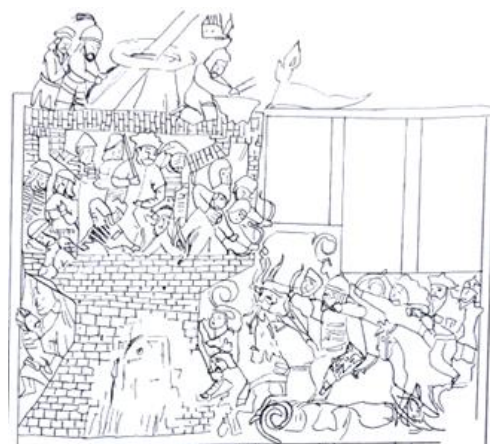
شاهنامه ۷۳۱ ه.ق

تصویر ۱۷. طرح خطی مجلس ۲ (نبرد کیخسرو و افراسیاب).