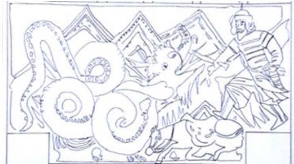
شاهنامه ۷۳۱ ه.ق

تصویر ۱۶. طرح خطی مجلس ۱ (نبرد بهرام گور با اژدها).