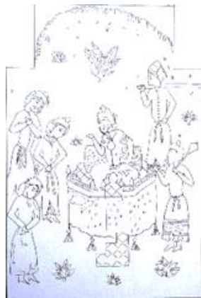
الف. شاهنامه ۷۹۶ ه.ق

مجلس ۵. نگاره «کیخسرو پسر سیاوش» در هر دو شاهنامه آل اینجو و آل مظفر دارای ترکیب بندی قرینه بوده و در هر دو شاهنامه مرکزیت در اثر و تأکید بر شخصیت اصلی دیده می شود. فضای تصویری این نگاره در شاهنامه ۷۳۱ ه.ق کاملاً پوشیده از فیگورهای انسانی و عاری از هر گونه تزیینات طبیعت است. سطوح رنگی تخت بدون بعدنمایی مشهود است. این نگاره دارای ترکیب بندی مثلثی به صورت متقارن می باشد. در شاهنامه ۷۹۶ ه.ق فضای تصویری باز مخصوصاً در بالای کادر کاملاً مشهود است. کیفیت اجرایی ضعیف تر و همچنین عدم توجه به جزئیات نسبت به نگاره های اولیه آل مظفر قابل ذکر است ( تصویر ۲۰ ).