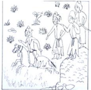
شاهنامه ۷۷۲ ه.ق