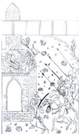
شاهنامه ۷۷۲ ه.ق

مجلس ۲. نگاره نبرد کیخسرو و افراسیاب در شاهنامه ۷۳۱ ه.ق دارای ترکیب بندی غیرقرینه می‌باشد که سنگینی عناصر در سمت چپ تصویر کاملاً مشهود است. ترکیب بندی مثلثی نامتقارن، فشردگی و پشت سر هم اجرا شدن فیگورها و کیفیت اجرایی ضعیف عناصر تصویر، فضای تنفس بسیار کمی در این نگاره ایجاد کرده است. این نگاره در شاهنامه ۷۷۲ ه.ق آل مظفر ترکیب بندی تقریباً قرینه دارد؛ به طوری که سنگینی بنای کاخ در طرف چپ، توسط فیگورهای انسانی متعدد در سمت راست، جبران شده است و کلاً حرکت چشم در صفحه کاملاً محسوس است. کیفیت ناب خط و اجرا، همچنین توجه به جزئیات قابل ذکر هست و روی هم انداختن پیکره‌ها و تراز بندی عناصر نوعی بعدنمایی را القا می‌کند (تصویر ۱۷).