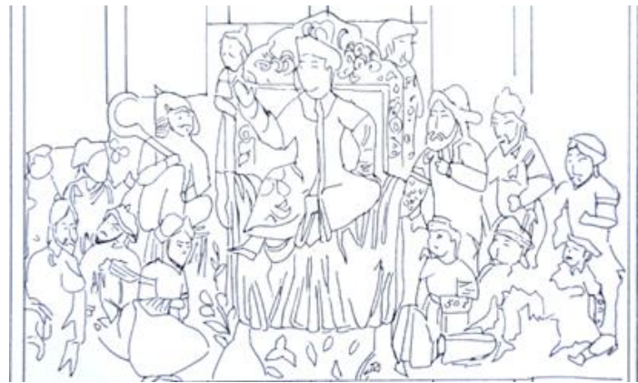
الف. شاهنامه ۷۳۱ ه.ق

تصویر ۲۰. طرح خطی مجلس ۵ (داستان کیخسرو پسر سیاوش).