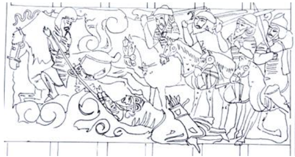
شاهنامه ۷۳۱ ه.ق

تصویر ۱۸. طرح خطی مجلس ۳ (داستان کاموس کشانی).