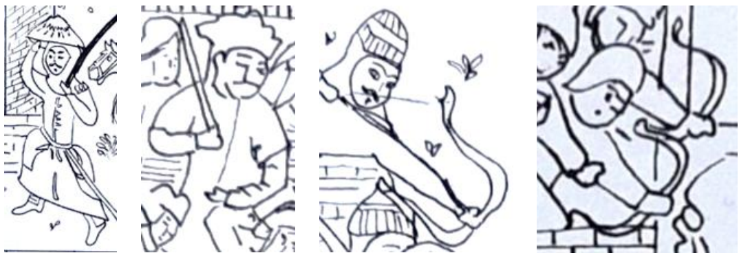
شاهنامه ۷۷۲ ه.ق.

مجلس ۲. در نگاره «نبرد کیخسرو و افراسیاب» در شاهنامه ۷۳۱ ه.ق شاهد کادر پلکانی رو به بالا هستیم که باعث حرکت چشم به سوی بالا می شود. ازدحام و شلوغی فیگورهای انسانی و حیوانی در نگاره نوعی پویایی و حرکت رو به جلوی صحنه نبرد را نشان می دهد. قسمتی از نگاره در بالا و خارج از کادر ترسیم شده است. شخصیت شاه (کیخسرو) در بالا، و پهلوان اصلی (افراسیاب) در پایین کادر، به صورت بزرگتر و شاخص تر ترسیم شده است. به علت کمبود منابع تصویری رنگی، از نظر ترکیب رنگ، به احتمال زیاد، همانند دیگر نگاره های شاهنامه ۷۳۱ ه.ق، نگاره دارای رنگ های غالب گرم می باشد. در شاهنامه ۷۷۲ ه.ق، شاهد استفاده از رنگ های گرم و سرد به صورت متوازن در کنار یکدیگر و همچنین کیفیت خوب رنگ ها هستیم. استفاده از تپه های گرد، افق دید رفیع، تزیینات گیاهی و زمین پوشیده از گل و گیاه از خصوصیات این نگاره است. اختصاص دادن گوشه کوچکی از تصویر به آسمان آبی، جزئیات بنای قلعه، همچنین البسه و ادوات جنگی مانند سپر و نیزه و حرکت و پویایی در فیگورها مورد توجه است. قرار گرفتن پشت سر هم فیگورها نوعی پرسپکتیو را القا می کند. همچنین جهت نشانه رفتن نیزه ها نوعی چرخش دید را در نگاره ایجاد می کند. چهره پردازی و پیکره نگاری به صورت قراردادی و با سبک مغولی مشهود است (تصویر ۱۲).