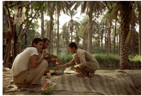
تصویر ۹. اسماعیل داوری، «مناطق عملیاتی جنوب»، ۱۳۶۳ ه.ش.