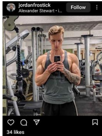
تصویر ۳. عکس سلفی.