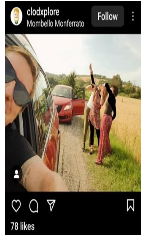
تصویر ۶. عکس سلفی.