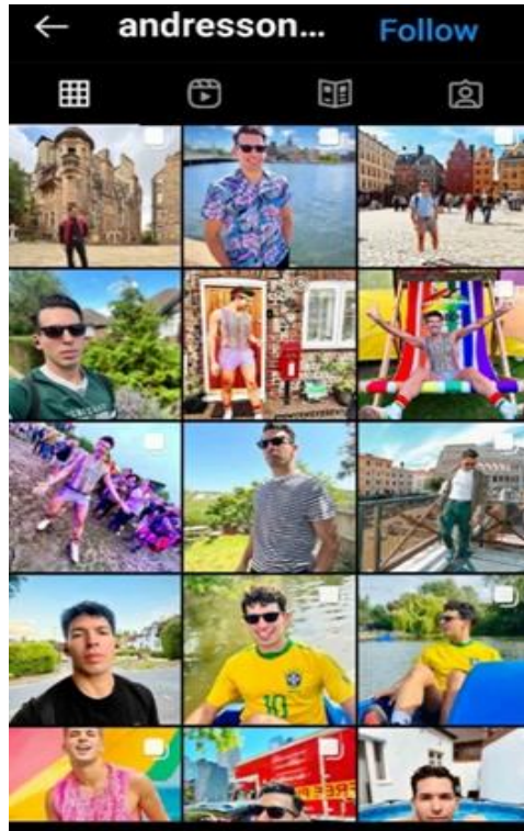
تصویر ۷. عکس سلفی.

خویشتن را در رسانه‌های اجتماعی تغییر می‌دهند (Rettberg, 2014, 35). به عبارتی می‌توان گفت که ما در هر تصویر پروفایلی ۲۸ که انتخاب می‌کنیم، صورت متفاوتی را از خودمان ارائه می‌داریم (تصویر ۷).