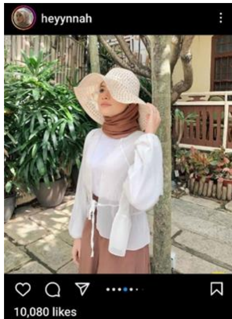
تصویر ۵. عکس سلفی.

می‌کردند. برای مثال، یک زن جوان گفت: «من به دنبال بهترین [تصویر] هستم، اما سلفی‌ای که خودم در اتاق خوابم گرفته‌ام را پست نمی‌کنم ... می‌دانید که به خاطر چنین کاری سرزنش می‌شوید». (Warfield, 2014, 4). زن جوان دیگری گفت: «من یک عکس زیبا را در فیس‌بوک پست می‌کنم، اما نه جنسی. اگر جنسی بود، شاید آن را در اینستاگرام قرار می‌دادم». این ممانعت‌ها و آگاهی در ارسال و اشتراک‌گذاری عکس‌های سلفی نشان می‌دهد که چگونه این زنان جوان اقدامات خود را در فضاهای آنلاین، آفلاین، عمومی و خصوصی کنترل می‌کنند (تصویر ۵).