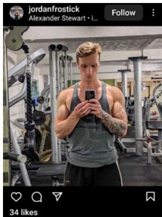
تصویر ۳. عکس سلفی.