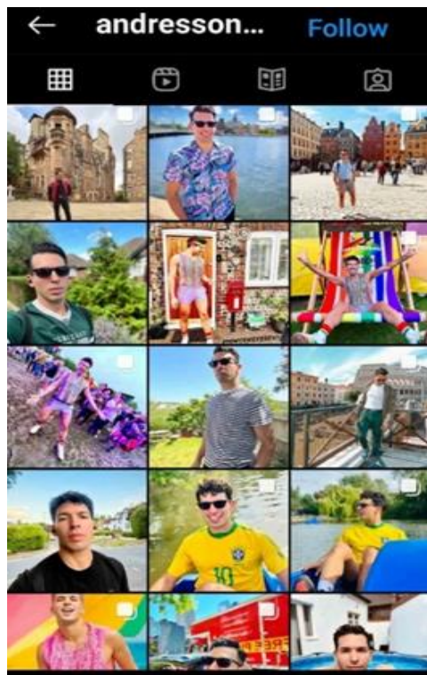
تصویر ۷. عکس سلفی. منبع: صفحه شخصی andresson.

خویشتن را در رسانه‌های اجتماعی تغییر می‌دهند (Rettberg, 2014, 35). به عبارتی می‌توان گفت که ما در هر تصویر پروفایلی ۲۸ که انتخاب می‌کنیم، صورت متفاوتی را از خودمان ارائه می‌داریم (تصویر ۷).