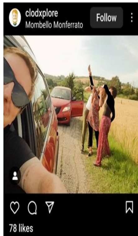
تصویر ۶. عکس سلفی.