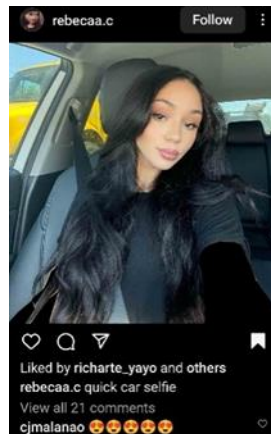
تصاویر ۲. عکس سلفی. منبع: صفحه‌های شخصی، سمت راست

Rebecca.c, Kandicereidphotography, سمت چپ