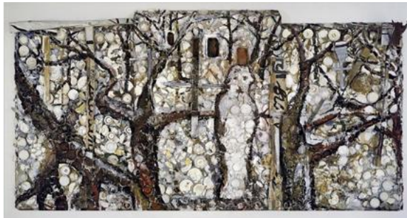
تصویر ۴. «دانشجوی پراگ»، جولیان اشنابل، ۱۹۸۳، میکس‌مدیا روی چوب با هدف حملهٔ قاطع به هژمونی‌های زیبایی‌شناسی مینیمالیسم و مفهوم‌گرایی.

اولین نظریه‌پرداز هنر که اصطلاح ماکسیمالیسم را در بحثی رسمی دربارهٔ هنر به کار برد، «رابرت پینکوس-ویتن» ۳۷ بود. در «پست‌مینیمالیسم» ۳۸ (۱۹۷۷) و سپس «اینترایز (ماکسیمالیسم)» ۳۹ (۱۹۸۳). او این اصطلاح را با اشاره به گروهی از هنرمندان مرتبط با نئوآکسپرسیونیسم در اواخر دههٔ ۱۹۷۰ و اوایل دههٔ ۱۹۸۰ به کار برد که در میان آن‌ها نام‌هایی مانند «دیوید سالی» ۴۰ و «جولین اشنابل» ۴۱ به چشم می‌خورد (تصاویر ۳ و ۴). برای توصیف گرایش‌های فیگوراتیو بیان شده توسط این هنرمندان در واکنش به سختی‌های مینیمالیسم و هنر مفهومی لحن عجیب و غریب کلی کتاب که به صورت مجموعه‌ای از یادداشت‌های روزانه ساختار یافته است و به طور آزادانه و ذهنی دربارهٔ رویدادهای هنری و هنرمندان برجسته در آن دوره اظهار نظر می‌کند، جای زیادی برای بحث و توضیح باقی می‌گذارد.