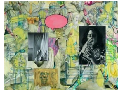
تصویر ۳. «مینگوس در مکزیک»، دیوید سالی، ۱۹۹۰، نمونه‌ای از نقاشی‌های ماکسیمال دیوید سالی.

بی‌ارتباط با بیشینه‌گرایی پینکوس-ویتن، تحلیلی طولانی از این مفهوم را می‌توان در «ماکسیمالیسم و لذت بصری» ۴۲ که توسط «کورتنی آر. دیویس» ۴۳ ، «ملیسا همپل» ۴۴ و «ربکا ویلسون موناهان» ۴۵ نوشته شده، یافت. کتابی که به کار «جین لیتون-وندبرگ» ۴۶ اختصاص یافته است. اولین هنرمندی که به گفتهٔ نویسندگان کتاب خود را به‌عنوان یک ماکسیمالیست در دههٔ ۱۹۸۰ م معرفی کرد. این کتاب نمای کلی خوبی از ماکسیمالیسم ارائه می‌دهد، با چند فصل که هدف آن تعریف مفهوم ماکسیمالیسم و قرار دادن آن در چارچوب فرهنگ معاصر است. با وجود این، گفتمان کتاب به‌طور قابل درک توسط محتوای خاص کار لیتون-وندبرگ شکل گرفته است که گرچه هنرمندی ماکسیمالیست معرفی شده است، ولی کارهای او تنها نمونه‌ای از اشکال هنری است که ماکسیمالیسم می‌تواند از نظر بیان بصری و تمرین هنری داشته باشد (تصویر ۵).