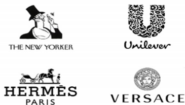
تصویر ۱۷. چند نمونه لوگوی برنده‌های معروف طراحی شده با استایل ماکسیمالیستی. منبع: https://vividcreative.studio/post/the-art-of-maximalism-in-graphic-design

https://saatchiart.com/art/Photography-Backwaters-Mountain/690938/10245029/view