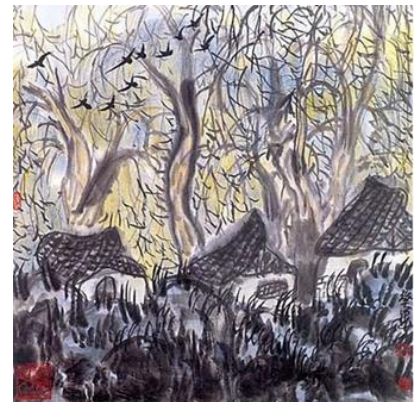
تصویر ۱۲. «در جنگل»، لی هواشنگ، ۱۹۹۳، تکنیک جوهر و شستشو.

از سوی دیگر، ماکسیمالیسم به تصویری آشفته اشاره دارد که عناصر زیادی در آن با یکدیگر در حال رقابتند تا نگاه مخاطب را به سوی خود جلب کنند. با این حال، در این هرج و مرج تعادلی نیز وجود دارد. ایجاد این نوع تصویر به‌صورت متعادل بسیار سخت است. با وجود این می‌تواند برای چشمان بیننده لذت‌بخش باشد و به او اجازه می‌دهد تا در تصویر کاوش کند. این موارد در عکس‌هایی که به‌سبک ماکسیمال گرفته شده‌اند، قابل مشاهده است. عکس‌های ماکسیمال معمولاً دارای قاب‌هایی بسیار شلوغ هستند که در آن المان‌هایی بسیار زیاد و گاهاً بی‌ارتباط با یکدیگر در کنار هم دیده می‌شوند. المان‌هایی با رنگ‌هایی تند و متضاد و بافت‌هایی درهم تنیده. در