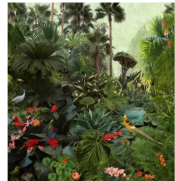
تصویر ۱۴. «کوه پشت آب»، نادیا آتورا، نمونه‌ای از عکاسی منظره ماکسیمال.

https://gucci.com/ca/en/stories/article/agenda_2016_issue04_prefall_adv_campaign