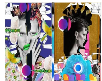
تصویر ۱۶. نمونه‌ای از آثار هنرمند لولا لوکا ارائه شده در ورکشاپ سال ۲۰۲۳ کالج هنری هرفورد با موضوع طراحی گرافیک حداکثری. منبع: