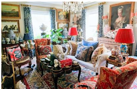
تصویر ۱۰. نمونه‌ای از معماری و طراحی داخلی ساختمان به‌سبک ماکسیمال. طراح یاکوب لوکاس.

بلندپروازانه‌ترین تعریف بیشینه‌گرایی در دانشگاه توسط «پاتریک تمپلتون» ۵۲ در پایان‌نامه‌ای با عنوان «تعریف ماکسیمالیسم، درک مینیمالیسم» (۲۰۱۳) ارائه شده است. اگرچه این مطالعه به بررسی امکان معماری حداکثری می‌پردازد (تصاویر ۹ و ۱۰) رویکرد دقیق آن به موضوع و درگیری با مفاهیم فلسفی مرتبط، آن را برای هر رشته‌ای که در آن گرایش‌های ماکسیمال آشکار می‌شوند و انعکاس می‌یابند، مفید می‌سازد. تحقیقات تمپلتون ناشی از فقدان یک تعریف ساختارمند و آکادمیک از بیشینه‌گرایی است. این بازتاب‌نگرانی‌های مشابهی است که توسط نویسندگان «فرانک زاپا، کاپیتان بیف‌هارت و تاریخ مخفی ماکسیمالیسم» ۵۳ بیان شده و نشان‌دهنده فقدان این واژه در واژگان آکادمیک است و از «عدم توجه جدی به توسعه زیبایی‌شناسی حداکثری» ابراز تأسف می‌کند. به همین ترتیب، «جرمی کول آنجلو» ۵۴ ، منتقد ادبی خاطر نشان می‌کند که «اگرچه اصطلاح ماکسیمالیسم به‌طور منظم برای چندین دهه استفاده شده است، هرگز سنت انتقادی پایداری از ماکسیمالیسم وجود نداشته و استفاده از آن در هنر و ادبیات بسیار پراکنده بوده است» (Pioaru, 2021).