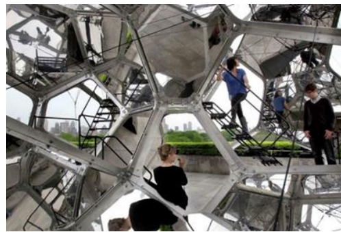
تصویر ۹. «شهر ابری»، توماس ساراسینو، ۲۰۱۲، اثر معماری طراحی شده به‌سبک ماکسیمال که در آن از آیین، نور و کلاژ برای رسیدن به شرایط حداکثری استفاده شده و سوژه با ورود به آن نمی‌تواند بین آنچه به‌معنای واقعی کلمه به‌عنوان ابژه وجود دارد و آنچه به‌عنوان تصویر صرف وجود دارد، تمایز قائل شود. نصب شده بر پشت بام موزه متروپولیتن در سال ۲۰۱۲.