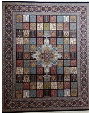
تصویر ۲. فرش ایرانی با طرح قابی یا خشتی، یک نمونه عالی از هنر ایرانی با ویژگی‌های ماکسیمالیستی.

و تاریخ‌گرایی معماری و دکوراسیون قرن نوزدهم بود و بیشتر در طراحی داخلی، هنرهای گرافیک، میلان، هنر شیشه، منسوجات، سرامیک، جواهرات و کارهای فلزی نمود داشت. نهضت هنر نو حاصل یک دگرگونی در ساختار اجتماعی، رویکردهای زیبایی‌شناسی، تأثیرپذیری از هنرهای غیر اروپایی و پاسخی مناسب به زمانه خود بود. این هنر در نقطه حساسی از چرخش به سوی مدرنیسم به‌عنوان نقطه‌اتصال میان سبک‌های قدیمی و هنر مدرن قرن بیستم یک لحظه به‌شمار می‌رود. این نهضت یک بدعت هنری بود. از ویژگی‌های بارز هنر نو می‌توان به تأثیر از اشکال گیاهی (طرح‌های گل‌مانند پیچک و شیپوری) گرایش به خطوط موج و منحنی، سرشار بودن از ملاحظات زیبایی‌شناسانه، تأکید قوی بر عناصر تزئینی، حرکات موزون و پر پیچ و تاب و نقوش اسلیمی، نرمی و لطافت، استفاده از رنگ‌های روشن، جلوه‌های داستانی، الگوبرداری از هنرهای قدیمی گوتیک، روکوکو، هنر ژاپنی و سفال‌های ایرانی، کارهای دوران ویکتوریا و شیشه‌کاری رومی اشاره کرد (Art Nouveau, 2024). هنر آرت‌نوو در زمینه تزئینات و دکوراسیون داخلی و هنرهای کاربردی از هنر مشرق‌زمین مخصوصاً هنر ایرانی بهره بسیار گرفت. شاخص‌ترین تأثیرپذیری از این هنر در زمینه دکوراسیون و صنایع‌دستی بود که به بهترین شکل در آثار اساتید بزرگ این سبک نمایان شد. هنرمندان برجسته‌ای همچون «کامفورت تیفانی» ۲۷ ، «امیل گاله» ۲۸ و «ویلیام موریس» ۲۹ بیشترین شیفتگی را به هنر غنی ایرانی نشان دادند. با توجه به تأثیرپذیری هنر آرت‌نوو از هنر ایرانی و شباهت‌ها و دارا بودن ویژگی‌های مشترک آن با آثار هنری ماکسیمالیستی می‌توان رد پای ماکسیمالیسم را در هنرهایی چون فرش، معماری کاشی‌کاری و آیینه‌کاری ایرانی نیز جست‌وجو کرد (تصاویر ۱ و ۲)