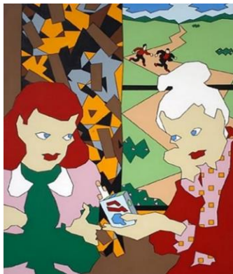
تصویر ۶. «وضعیت نگران کننده»، داگی فیلدز، ۱۹۶۹، اکریک روی بوم، نمونه‌ای از کارهای ماکسیمال داگی فیلدز.