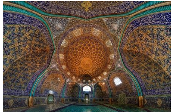
تصویر ۱. کاشیکاری و معماری مسجد شیخ لطف‌الله اصفهان امین فداکار، نمونه‌ای برجسته از هنر ایرانی با ویژگی‌های ماکسیمالیستی.

«آرت‌دکو» ۳۰ که سبک مدرن نیز نامیده می‌شود، جنبشی در هنرهای تزئینی و معماری است که در دهه ۱۹۲۰ م نمایان شد و در طول دهه ۱۹۳۰ م به یک سبک اصلی در اروپای غربی و ایالات متحده تبدیل گشت. نام آن توسط «بویس هیلیر» ۳۱ مورخ انگلیسی از نمایشگاه بین‌المللی هنرهای تزئینی و صنایع مدرن (آرت‌دکوراتیو) برگرفته شده است که در سال ۱۹۲۵ م در پاریس برگزار شد، جایی که این سبک برای اولین بار در آن به‌نمایش گذاشته شد. طراحی آرت‌دکو نشان‌دهنده مدرنیسمی بود که به مد تبدیل شد. محصولات آن شامل اقلام لوکس