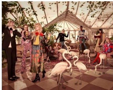
تصویر ۱۵. «کمپین پیش از پاییز ۲۰۱۶ گوجی»، گلن لاجفورد، ۲۰۱۶، نمونه‌ای از طراحی و عکس‌های مد ماکسیمال.

نگاه اول شاید یک عکس ماکسیمال بسیار سردرگم کننده و عجیب به نظر برسد، ولی همین ویژگی‌ها به عکس خاصیت بصری متفاوتی می‌بخشد. این عکس‌ها بیننده را به کاوش در اجزای سازنده آن دعوت می‌کنند و حسی عجیب را در او ایجاد می‌نمایند. حسی که شاید برایش قابل بیان نباشد، ولی متوجه می‌شود با عکسی روبه‌روست که پیش از این نظیرش را ندیده است. استفاده از سبک ماکسیمال در ژانرهای مختلف عکاسی مورد استفاده قرار می‌گیرد؛ مانند عکاسی خیابانی، معماری و منظره (تصویر ۱۴). ولی بیشترین استفاده از این سبک در سال‌های اخیر در ژانر عکاسی مد بوده است. عکاسان برنده‌های معروف مد و پوشاک مانند «گلن لاجفورد» ۸۹ ، مرت آلاس و «مارکوس پیگوت» ۹۰ (مرت و مارکوس) که طراحی‌های اشخاصی چون «لساندرو میکله» ۹۱ طراح لباس ماکسیمالیست ایتالیایی و پدر معنوی ماکسیمالیسم در دنیای مد را به تصویر می‌کشند (تصویر ۱۵) ماکسیمالیسم امروزه در گرافیک دیزاین نیز به شکلی فراگیر در حال استفاده است و در طراحی لوگو، پوستر، جلد مجلات و کاور آلبوم‌های موسیقی شاهد نمونه‌های بسیاری از آن هستیم (تصاویر ۱۶ و ۱۷).