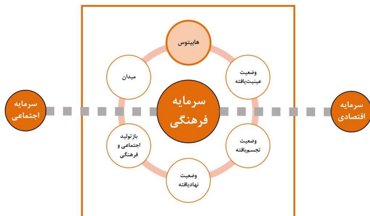
تصویر ۱. مدل شش مؤلفه‌ای سرمایه فرهنگی، با تأکید بر مؤلفه «هابیتوس»، و ارتباط آن با سرمایه اقتصادی و سرمایه اجتماعی. منبع: (Sablan & Tierney, 2014).