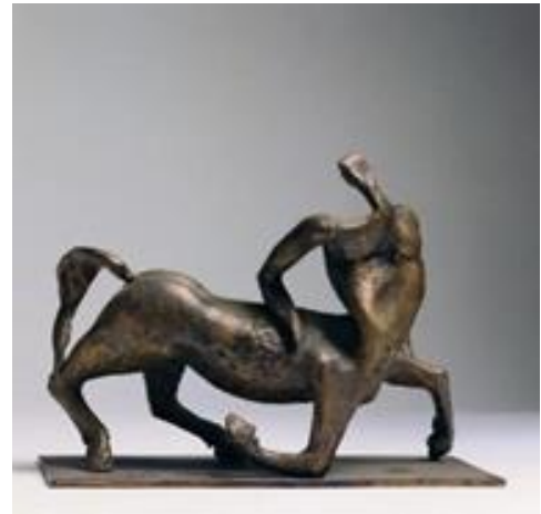
تصویر ۷. «سانتور»، برنز.