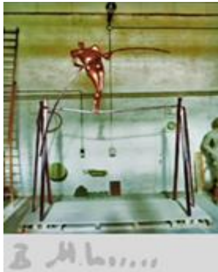
تصویر ۱۰. «بندباز»، برنز و فولاد، ۵۰۰×۳۵۰×۳۰۰ سانتیمتر، ۱۳۵۷. منبع: خلعتبری، ۱۳۹۶، ۷۶.