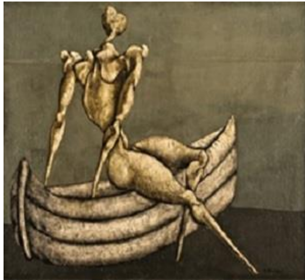
تصویر ۲. «مردی کنار قایق»، رنگ و روغن روی بوم، ۱۵۰×۱۰۰ سانتیمتر. ۱۳۴۵. منبع: خلعتبری، ۱۳۹۶، ۲۱۵.