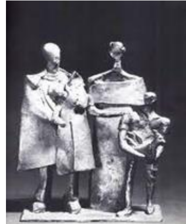
تصویر ۴. «خانواده سلطنتی»، برنز، ۱۵۰×۳۰۰×۲۵۰ سانتیمتر، ۱۳۵۱.