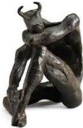
تصویر ۸. «مینوتور»، برنز، منبع: Mohassess, 2007، 54.