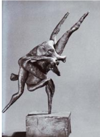
تصویر ۶. «دو کشتی گیر»، برنز، ۱۳۰ سانتیمتر، ۱۳۵۴. منبع: خلعتبری، ۱۳۹۶، ۷۰.