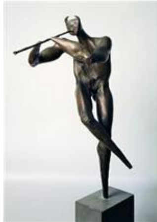
تصویر ۵. «نی لبک نواز»، برنز، ۲۰۰ سانتیمتر، ۱۳۵۲-۵۳. منبع: خلعتبری، ۱۳۹۶، ۶۲.