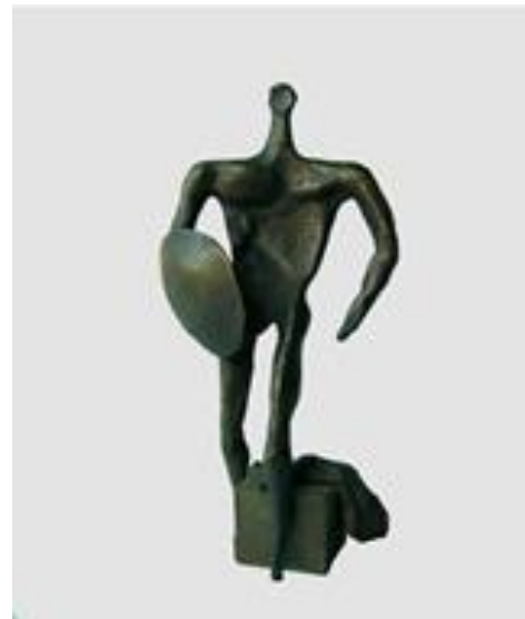
تصویر ۹. «جنگجوی با سپر»، برنز، منبع: Mohassess, 2007، 38.

مححص در سال ۱۳۵۷ از ایران خارج شد و بسیاری از مخاطبین مدت طولانی از وی بی‌خبر ماندند. در این دوران هنرمند از موضوعات پیشین فاصله گرفته و بیشتر سوژه‌های زمینی را برمی‌گزیند. در برخی از آثار مححص در این دوره، تهی‌بودگی شخصیت‌ها به شدیدترین شکل به‌نمایش درآمده است. به‌عنوان مثال در تصویر ۹ در مجسمه «نیم‌تنه» فیگور چیزی جز لایه‌ای پوست نیست. می‌توان گفت واقعیت وجودی انسان در اینگونه آثار مححص چیزی جز پوسته‌ای توخالی نیست. اوایل دههٔ هفتاد خورشیدی مححص به ایران بازگشت. در همین سال‌ها بیماری سرطان ریه در کنار آسم و بیماری‌های روده او را آزار می‌داد. او بخش بزرگی از آثارش را در همین دوره نابود کرد. هنرمند در دومین کتاب چاپ شده از مجموعه آثارش در ایتالیا تعداد آثاری را که تخریب کرده