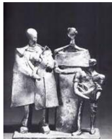
تصویر ۴. «خانواده سلطنتی»، برنز، ۲۵۰×۳۰۰×۱۵۰ سانتیمتر، ۱۳۵۱.