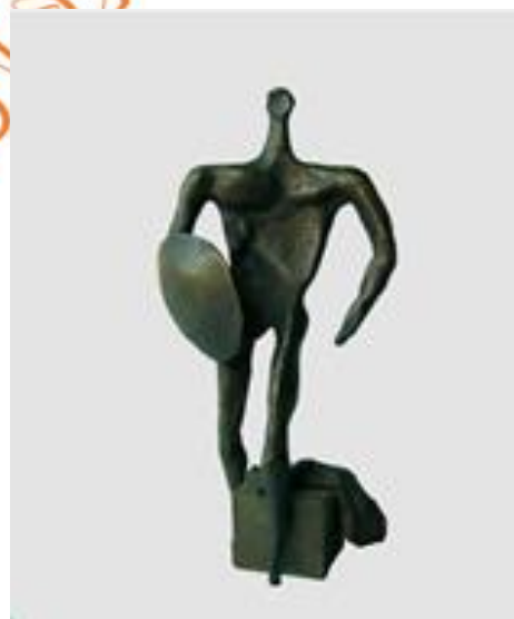
تصویر ۹. «جنگجوی با سپر»، برنز، منبع: Mohassess, 2007, 38.

مححص در سال ۱۳۵۷ از ایران خارج شد و بسیاری از مخاطبین مدت طولانی از وی بی‌خبر ماندند. در این دوران هنرمند از موضوعات پیشین فاصله گرفته و بیشتر سوژه‌های زمینی را برمی‌گزیند. در برخی از آثار مححص در این دوره، تهی‌بودگی شخصیت‌ها به شدیدترین شکل به‌نمایش درآمده است. به‌عنوان مثال در تصویر ۹ در مجسمه «نیم‌تنه» فیگور چیزی جز لایه‌ای پوست نیست. می‌توان گفت واقعیت وجودی انسان در اینگونه آثار مححص چیزی جز پوسته‌ای توخالی نیست. اوایل دههٔ هفتاد خورشیدی مححص به ایران بازگشت. در همین سال‌ها بیماری سرطان ریه در کنار آسم و بیماری‌های روده او را آزار می‌داد. او بخش بزرگی از آثارش را در همین دوره نابود کرد. هنرمند در دومین کتاب چاپ شده از مجموعه آثارش در ایتالیا تعداد آثاری را که تخریب کرده حدود پنجاه اثر عنوان می‌کند. بعداز آن مححص بار دیگر بساطش را جمع کرده و برای آخرین بار ایران را ترک