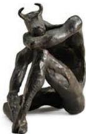
تصویر ۸. «مینوتور»، برنز، منبع: Mohassess, 2007، 54.