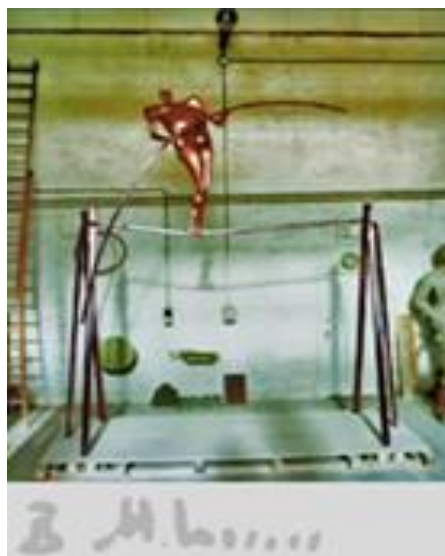
تصویر ۱۰. «بندباز»، برنز و فولاد، ۳۰۰×۳۵۰×۵۰ سانتیمتر، ۱۳۵۷. منبع: خلعتبری، ۱۳۹۶، ۷۶.