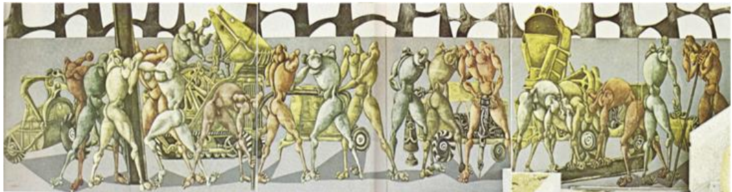
تصویر ۳. «روبو و مکانو»، رنگ و روغن و ترکیب مواد روی نئوپان، ۱۳۴۷.

عقایدش صحبت می‌کند. او خود را برای ایران پرسوناژی تاریخی عنوان می‌کند و درونمایهٔ آثارش را «محکومیت به وجود» می‌داند. در سال ۱۳۴۷ در دومین جشن هنر شیراز محصص با چند تابلوی برجسته حاضر می‌شود که مهمترین آن‌ها «روبو و مکانو» است. این تابلو که در تصویر ۳ مشاهده می‌کنید، فیگورهایی درهم‌تنیده است که به فعالیتی مکانیکی مشغول هستند. اثری با ابعاد بسیار بزرگ که در آن کارگران ربات‌شکلی درهم‌تنیده‌اند. عضلات و اندام‌هایشان بزرگ اما سرهایی کوچک دارند که قدرت تفکر را از آن‌ها سلب می‌کند. رنگ‌هایی کدر و کثیف که نشان از پوسیدگی و زنگ‌زدگی فضای نقاشی دارد.