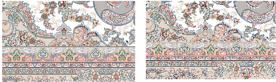
تصویر ۱۲. تغییر ابعاد نقشه قالی توسط هوش مصنوعی بوری، تبدیل قالی ۶ متری (چپ) به قالیچه (راست).

همانطور که در تصویر ۱۲ مشاهده می‌شود، تبدیل سایز ۶ متری به قالیچه‌ای با ابعاد 2.25 \times 1.5 توسط هوش مصنوعی نرم‌افزار بوری با مخاطره صورت گرفته است و هوش مصنوعی فوق‌قادر به اصلاح نقوش فرش به صورت استاندارد و کامل نیست و تمام نقوش چه از نظر طراحی، رنگ و نقطه به هم ریخته دیده می‌شود. نتایج مقایسه با چهار هوش مصنوعی در جدول ۳ نشان داده شده است: