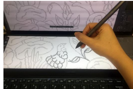
تصویر ۴. طراحی نقشه فرش بر روی صفحه دیجیتال.

۳. فرآیند طراحی دیجیتال فرش: در این شیوه، عناصر فیزیکی مانند کاغذ، مداد و پاک‌کن به‌طور کامل حذف می‌شود و از ابزارهای ترسیم دیجیتال و نرم‌افزارهای مبتنی بر آن‌ها به‌صورت مستقیم استفاده می‌گردد. طراح تمام مراحل طراحی را با قلم نوری بر روی صفحه دیجیتال اجرا می‌کند. انواع سخت‌افزارهایی که قابلیت استفاده از قلم و پد دیجیتال دارند، مورد استفاده این حوزه بوده است؛ مانند ای‌پد، وکام و غیره که معروف‌ترین و باکیفیت‌ترین برندها در این حوزه هستند. در ادامه مراحل طراحی به‌صورت مدرن (فرآیند طراحی دیجیتال) ارائه می‌شود: طرح را به‌صورت اتود و کم‌رنگ با کمک قلم نوری بر روی صفحه دیجیتال اجرا می‌کنند (تصویر ۴)، طرح به هر میزان دفعات که نیاز به اصلاح داشته باشد تغییر پیدا می‌کند، فایل نهایی را به ابعاد فرش مورد نظر تغییر داده و مراحل بعدی از جمله نقطه و رنگ بر روی نقشه اجرا می‌گردد و باقی مراحل مطابق با فرآیند طراحی نیمه‌سنتی است (تصویر ۳).