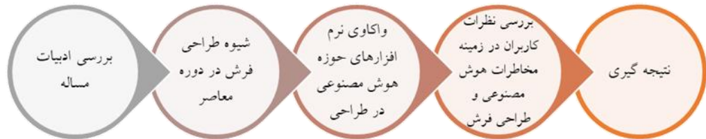
تصویر ۱. مدل مفهومی پژوهش.

در رابطه با هوش مصنوعی پرداخته شده، سپس نحوه طراحی فرش در دوران معاصر به صورت مشاهده و رفتارنگاری کاربر مورد بررسی قرار می‌گیرد؛ در ادامه با چهار نرم‌افزار رایج در حوزه طراحی و هوش مصنوعی سعی در توانایی خلق ایده برای طراحی فرش صورت گرفته است؛ در نهایت نظر کاربران را در ارتباط با هوش مصنوعی و آینده شغلی آن‌ها از طریق پرسش‌نامه، مورد کندوکاو قرار داده تا به نتایج درخوری نسبت به یک پژوهش علمی در ارتباط با مخاطرات هوش مصنوعی در آینده فرش ایران دست یابیم (تصویر ۱).