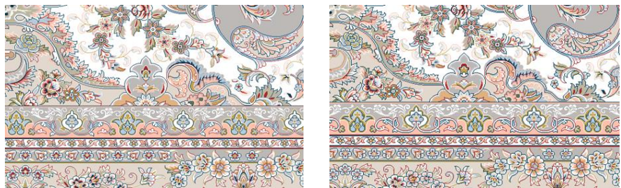
تصویر ۱۱. تغییر ابعاد نقشه قالی توسط هوش مصنوعی بوریا، تبدیل ۱۲ متری (چپ) به ۹ متری (راست).

همانطور که در تصویر ۱۱ مشاهده می شود، تبدیل سایز ۱۲ متری به ۹ متری به درستی صورت گرفته است. در برخی مواقع هوش مصنوعی قادر به تشخیص برخی نقوش در بوریا نیست و با سرهم سوار (دوبل) شدن نقطه ها، روبه رو هستیم که تصحیح نهایی، مجدداً باید توسط اصلاح کننده انسان صورت گیرد تا ایرادات ایجاد شده توسط هوش مصنوعی در تبدیل اصلاح نقشه در دو سایز به یکدیگر، توسط اصلاح گر انسان رفع گردد.